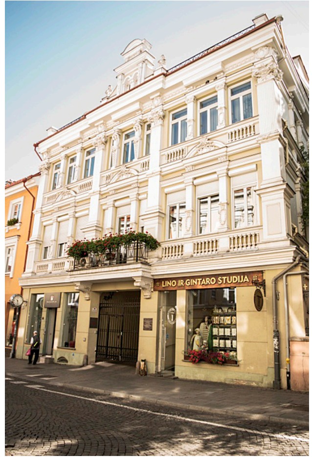
2 pav. Vilniaus imperatoriškojo universiteto Terapijos klinika, įkurta 1805 m. Šiame pastate vėliau įsikūrė Chirurgijos (1808 m.) ir Akušerijos (1815 m.) klinikos. Šiandien – pastatas Didžiojoje g. 10, Vilniuje.

J. Domherio darbe nurodytos bendrosios miego arterijos (BMA) perrišimo indikacijos. BMA perrišama, jei nustatoma: 1) miego arterijos aneurizma; 2) komplikuota miego arterijos ar jos stambųjų šakų žaizda, kurios jokiais kitais chirurginiais būdais neįmanoma sutvarkyti;