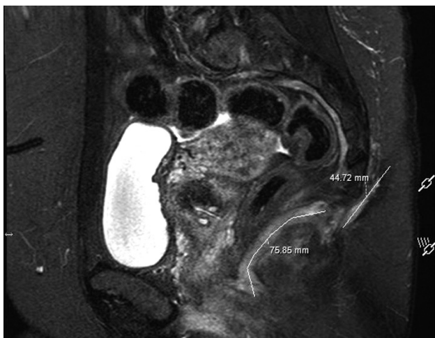
1 pav. Dubens organų MRT

Praėjus trimis mėnesiams nuo apsilankymo VUL SK KP, pacientė hospitalizuota planine tvarka operaciniam absceso ir fistulių gydymui. Operacijos pradžioje į epitelinės landos išėjimo angą suleista metileno mėlynojo dažų.