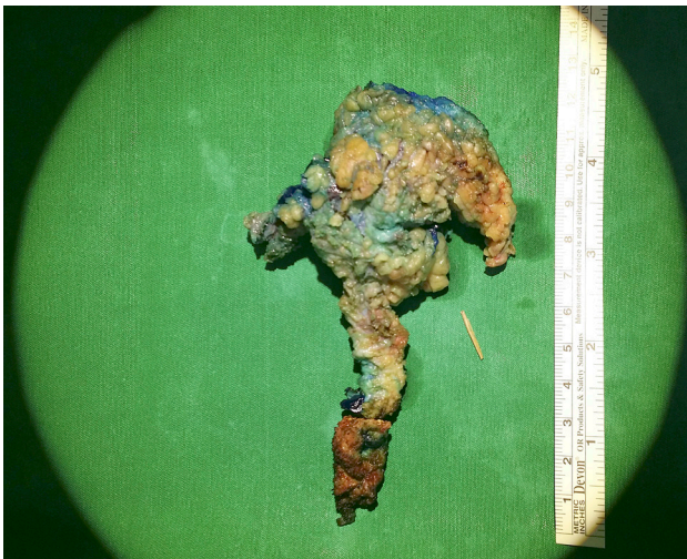
3 pav. Svetimkūnis ir kryžkaulio pleišto formos odos-poodžio lopas su pūliniu ir fistulėmis

Jie į tiesiąją žarną ar išangės kanalą nepateko. Fistulės ir abscesas pašalintas su odos lopu sveikų audinių ribose iki kryžkaulio ir išorinio išangės rauko, tiesiosios žarnos ir makšties, šių struktūrų nepažeidžiant (2 pav.). Pūlinyje šalia rauko rastas 1,5 cm ilgio adatos formos svetimkūnis (3 pav.). Po operacijos svetimkūnis buvo identifikuotas odontologės kaip odontologinis gražtas. Pacientė teigia prisimenanti, kad prieš keletą metų tokį gražtą prarado ją gydanti odontologė atlikdama procedūrą. Manoma, kad rastas svetimkūnis ir yra pagrindinis liekamosios infekcijos etiologinis veiksnys. Žaizda išplauta betadino tirpalu, drenuota dviem drenais, susiūta pavienėmis adaptacinėmis siūlėmis, jų nekabinant prie antkaulio.