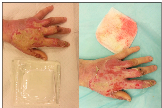
5 paveikslas. Dešiniojo dilbio 2B° nudegimas, 4 dienos po nudegimo, atlikta nudegimo centrinės dalies nekrektomija „Debrisoft“ kempinėle