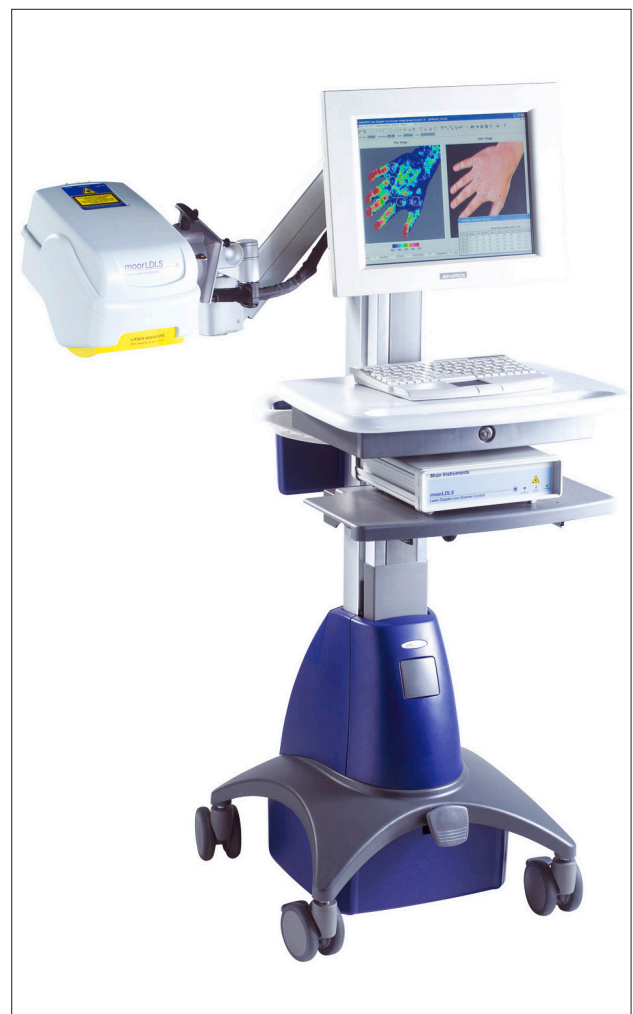
1 paveikslas. „MoorLDLS2“ lazerinės doplerografijos aparatas

LSMUL KK Plastinės ir rekonstrukcinės chirurgijos klinikoje nudegimo gyliui nustatyti naudojamas „MoorLDLS2“ lazerinės doplerografijos aparatas (1, 2, 3 pav.).