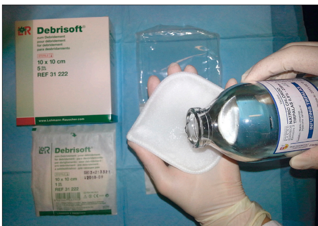
4 paveikslas. „Debrisoft“ kempinėlės paruošimas

Kiekvienai skirtingai pažeistos odos vietai tikslinga naudoti naują kempinėle. Jeigu žaizda didelė, reikia naudoti kelias kempinėles tai pačiai žaizdai (4, 5 pav.).