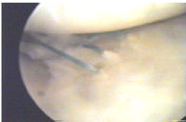
2 pav. Susiūtas radialinis vidinio menisko plyšimas (autorių artroskopinės operacijos metu padaryta nuotrauka)

Vertinant Lysholmo skale, geri ir labai geri rezultatai, praėjus 18 mėnesių po menisko susiuvimo, buvo 20 (91 %) ligonių, o patenkinami – 2 (9 %). Praėjus tokiam pačiam laikui po artroskopinių intervencijų, Lysholmo skalė pasiekė 92,09 \pm 4,37 taškus (1 pav.). Kelio sąnario funkcija atkurta ir simptomai sumažėjo statistškai reikšmingai ( t = 18,32 , p < 0,05 ).