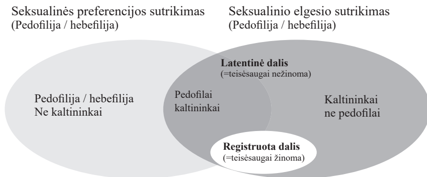
Schema. Seksualinės preferencijos ir seksualinio elgesio sutrikimų atskyrimas 30

Apibendrinant reikia pasakyti, kad psichikos ligų diagnostikoje pedofilija laikoma parafilija (nuo normos nukrypstančiu seksualiniu interesu), o kaip pedofilinis sutrikimas (liga) ji diagnozuojama tada, kai seksualinis interesas lytiškai nesubrendusiems vaikams yra ilgalaikis, kryptingas ir intensyvus, pasireiškiantis nesiliaujančiomis seksualinėmis mintimis, fantazijomis, potraukiais ar elgsena, sukeliantis kančią pačiam asmeniui arba aplinkiniams. Tik nedidelę seksualinės prievartos prieš vaikus atvejų dalį galima sieti su pedofilija (žr. schema ), o didžioji seksualinės prievartos, įskaitant ir padarytos dėl pedofilinio sutrikimo, atvejų dalis yra latentinė.