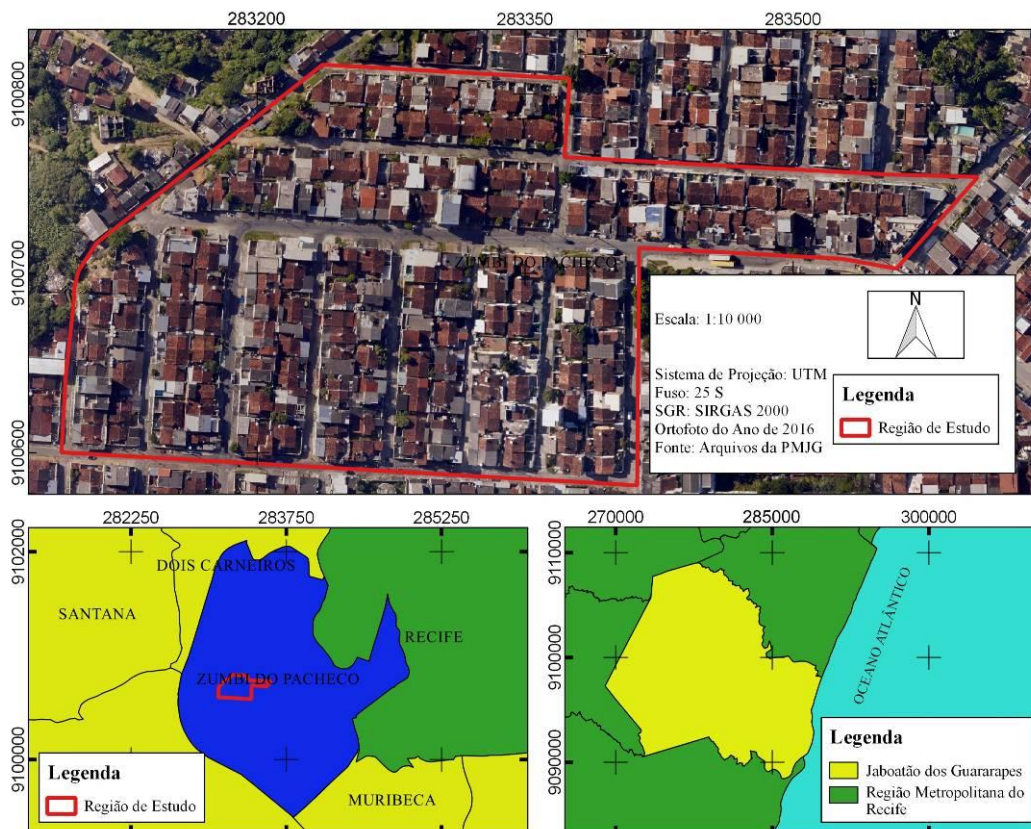
Figura 1 – Localização da região de estudo

A região de estudo está inserida na microrregião da UR-11, bairro do Zumbi do Pacheco, no município do Jaboatão dos Guararapes (Figura 1) localizada entre as coordenadas UTM 9.100.598,023 mN e 283.136,056 mE e, 9.100.751,512 mN e 283.594,170 mE com uma área de 0,062 quilômetros quadrados, correspondendo a 0,024% do município.