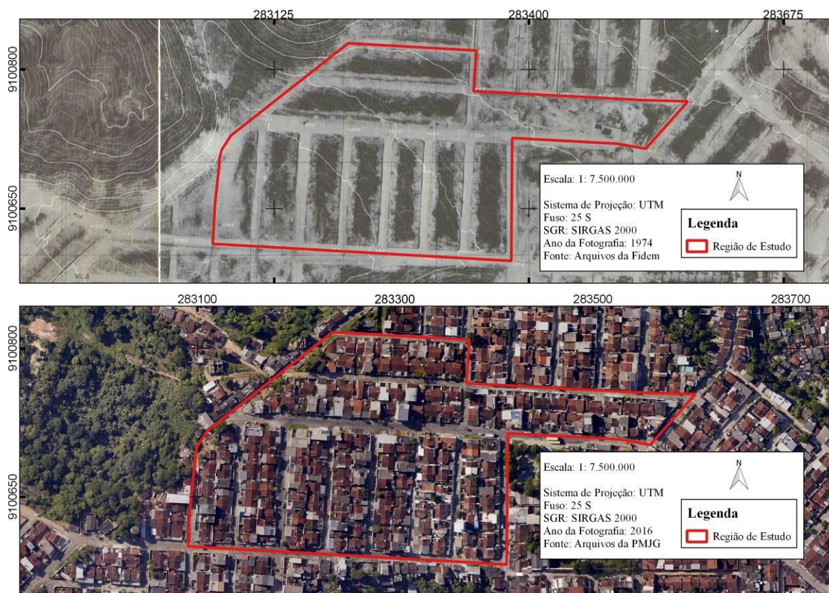
Figura 2 – Análise comparativa da região de estudo entre os anos de 1974 e 2016

urbanização na região de estudo, como pode ser observado na Figura 2.