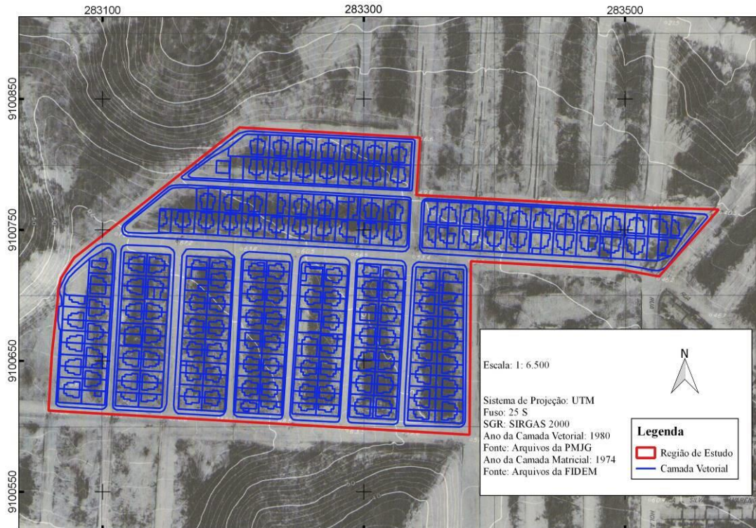
Figura 3 – Análise comparativa da região de estudo entre os anos de 1974 e 1980