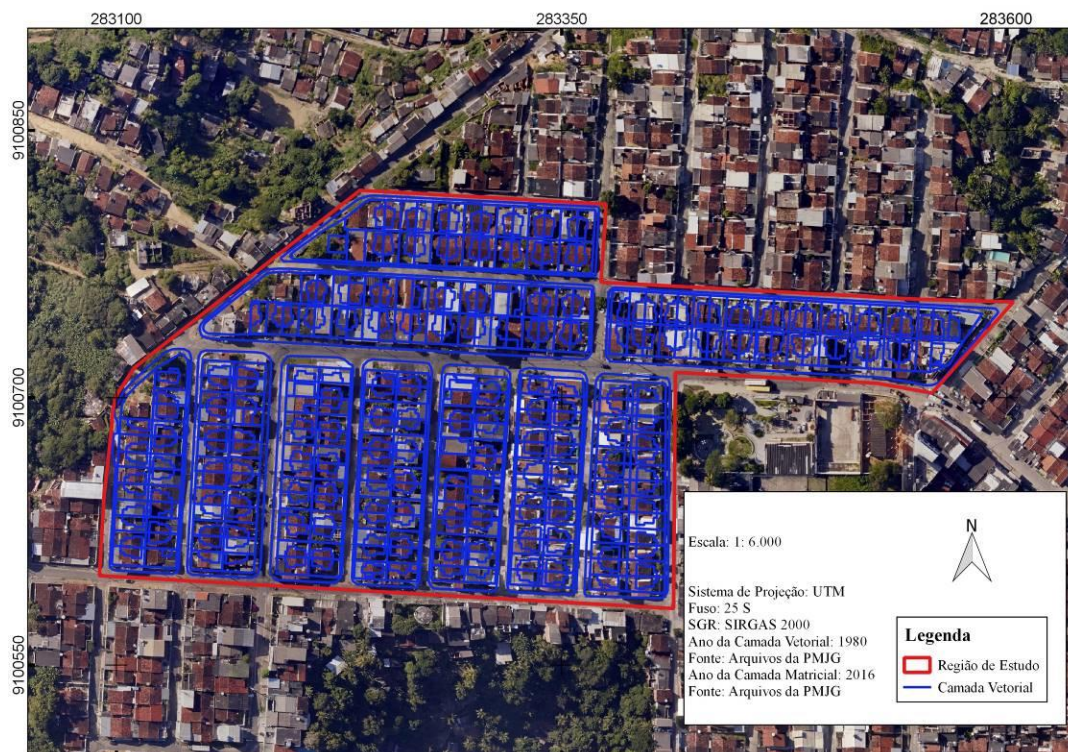
Figura 4 – Análise comparativa da região de estudo entre os anos de 1980 e 2016