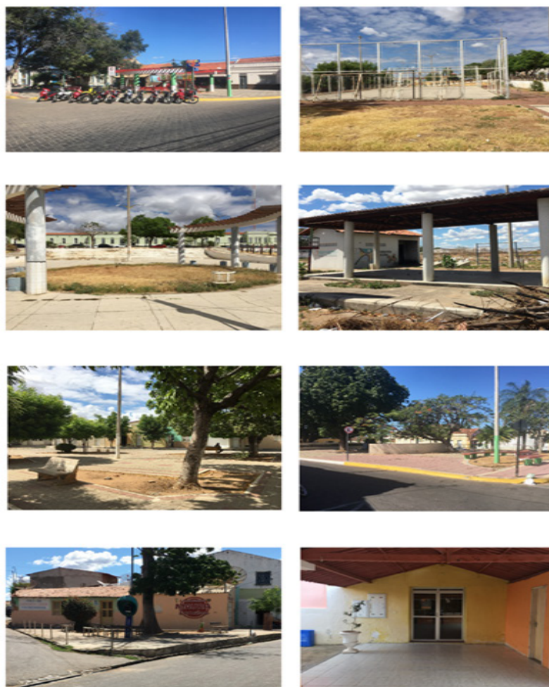
Figura 01 - Condições de uso de equipamentos de lazer. Iguatu-CE.