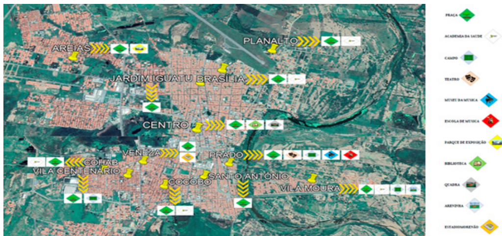
Figura 3 - Distribuição Espacial dos Equipamentos de Esporte e Lazer da cidade de Iguatu-CE, 2019.

que quanto mais qualificados estiverem esses espaços, maior será o número de usuários frequentadores (SILVA; ELALI, 2016).