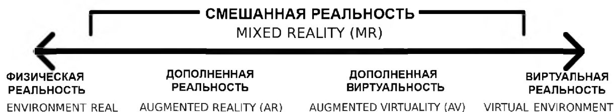
Рис. 1. Континуум виртуальности Пола Милграма и Фумио Каширо

постиндустриальную эпоху и третья технологическая революция изменили статус-кво в современной скульптуре.