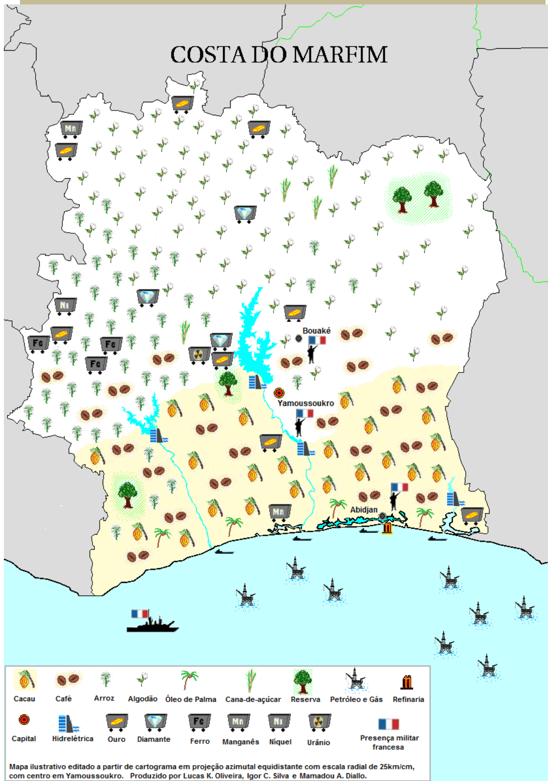
Mapa 2 – Costa do Marfim: Recursos Naturais e Regiões Agrícolas