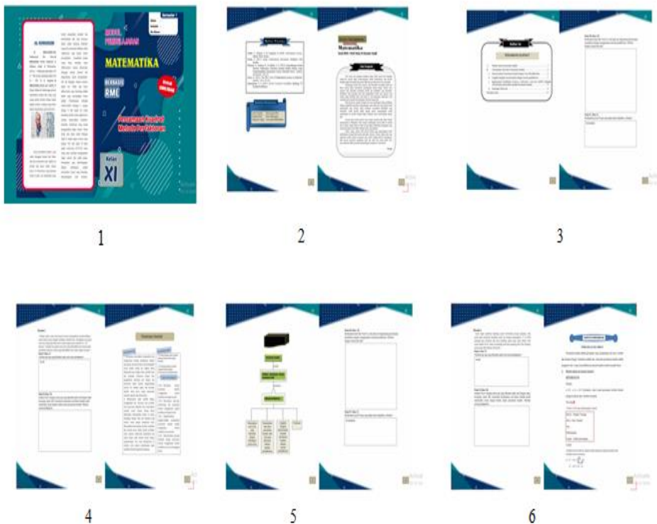
Gambar 2 Desain Awal Modul Berbasis RME

3) Isi modul dilakukan dengan mengembangkan materi persamaan kuadrat metode pemfaktoran menjadi lebih luas. Isi modul terdapat istilah “ The King ” sebagai catatan kecil untuk siswa dan adanya pantun nasehat matematika agar nantinya siswa menjadi lebih semangat dalam menggunakan modul pada saat pembelajaran. Kemudian, merancang mulai dari halaman kata pengantar, daftar isi, peta konsep, materi persamaan kuadrat, contoh soal, soal penilaian siswa, daftar pustaka hingga biodata penulis. Kemudian yang terakhir adalah cover sampul belakang modul pembelajaran berbasis RME. Berikut adalah desain awal modul berbasis RME: