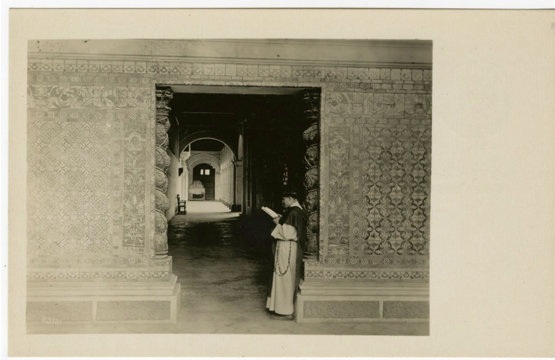
La Iglesia de Santo Domingo en Lima

Sin embargo, faltan varias representaciones del Perú. La comida, como platos culturales regionales y productos locales, está ausente. Faltan las artesanías locales y las industrias menos afectadas por las empresas extranjeras, particularmente la cerámica peruana (artículos frecuentemente cotizados por coleccionistas). Aunque las palmeras se encuentran en las imágenes del entorno urbano, la flora nativa en su hábitat natural fuera de la ciudad no está representada. En respecto a las personas y los hogares, la vida fuera de la ciudad en las zonas rurales se muestra marginalmente y revela una esterilidad que no ha sido tocada por la maquinaria económica moderna de la época.