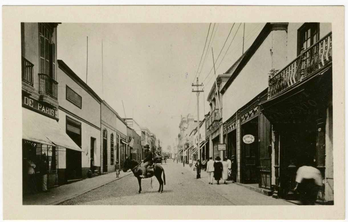
Sección de negocios en Tacna

Breves descripciones escritas por la Hispanic Society of America se encuentran en el reverso de las postales indicando los lugares emblemáticos, actividades y personas que se ven en las imágenes. A pesar del breve texto de una o dos líneas, uno puede percibir la preferencia por cierta información visual, así como una ausencia notable de otra información. Las escenas "típicas" y las casas "de la clase más pobre" se observan en la ciudad portuaria de Mollendo, mientras que el centro urbano de estilo europeo modernizado de Tacna es alabado como una "ciudad limpia y próspera". Este tratamiento sugiere un sesgo o una forma occidental de conceptualizar la noción de progreso. Aunque los grupos indígenas constituyen un porcentaje significativo de la nación multiétnica, están agrupados bajo "indios" en las descripciones de las postales sin referencia a su identidad étnica. La falta de distinción de las personas fotografiadas y la preferencia por escenas 'modernizadas' eclipsa la representación de la identidad indígena peruana.