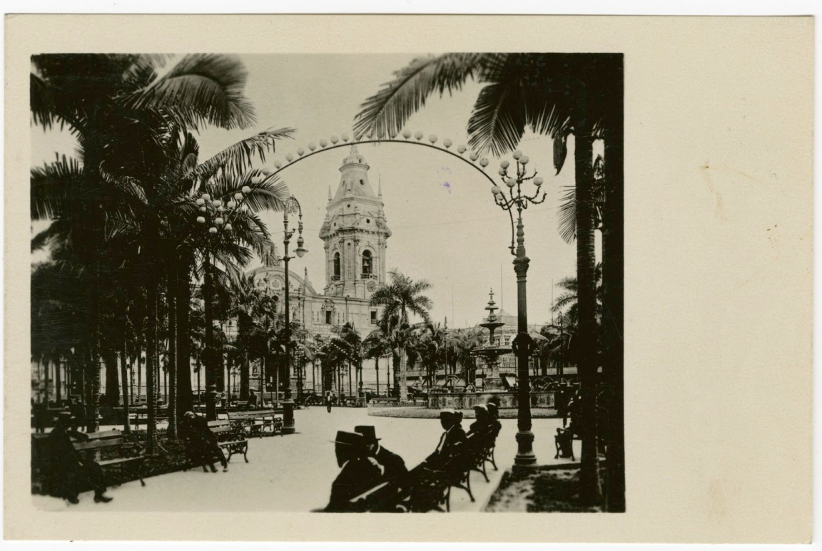
La Plaza de Armas en Lima

El comienzo del siglo XX trajo cambios políticos, económicos y sociales al Perú. Después de las devastadoras pérdidas causadas por la Guerra del Pacífico a fines del siglo XIX, la necesidad de reconstruir y reformar la sociedad peruana se prestó a las oportunidades económicas que presentaba la modernización. Entrar en la economía mundial hizo al Perú vulnerable a la influencia extranjera y al capitalismo occidental, y el mayor interés extranjero a través del comercio, la industria y el turismo comenzó a moldear el Perú moderno de manera positiva y negativa. Con el pasado y el presente convergiendo en esta coyuntura crítica, las imágenes presentadas aquí muestran al Perú antiguo y nuevo existiendo en esta dualidad.