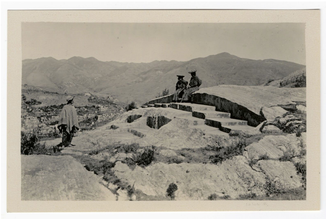
Una vista desde la cima de la colina del trono inca frente al sol naciente en Cuzco

Tarjetas postales representan características destacadas de lugares en ciertos puntos históricos y, por lo tanto, dejan un rastro único de documentación comercial, social y ambiental. Desde su invención, han servido como un método de comunicación rápido y pintoresco que normalmente se realiza durante un viaje, y se han convertido en un elemento dominante para el turismo en el siglo XX. La deltiología, el acto de coleccionar postales, era solo un tipo de actividad que los turistas y empresarios extranjeros practicaban mientras estaban en Perú en la década de los 1920. Los textiles y la cerámica peruana también llamaron la atención de los coleccionistas. Los productos de lana, las mantas tejidas coloridas, y las vasijas huaco de barro creadas por siglos de pueblos indígenas poseían un atractivo visual y un valor cultural para los extranjeros.