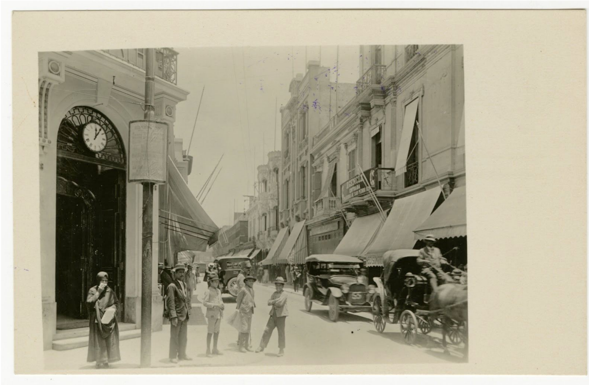
Centro comercial de Lima

Problemas de representación en las postales reflejan la lucha por construir una identidad nacional en medio de la modernización durante los 20s. Con una economía cada vez más dependiente en la demanda extranjera, surgió una presencia más fuerte y una influencia occidental en los centros de actividad empresarial, nuevos y antiguos. Las empresas industriales a gran escala aparecieron en lugares urbanos y remotos como Lima y Casapalca. Las postales dan evidencia de la escala y la gran actividad industrial en varias imágenes ilustrando la fundición de cobre y la exportación de materiales, así como algunas ilustrando el hilado de lana y la extracción de caucho. Sin embargo, señales de las extenuantes condiciones laborales y las presiones sobre los trabajadores locales están ocultos a la vista.