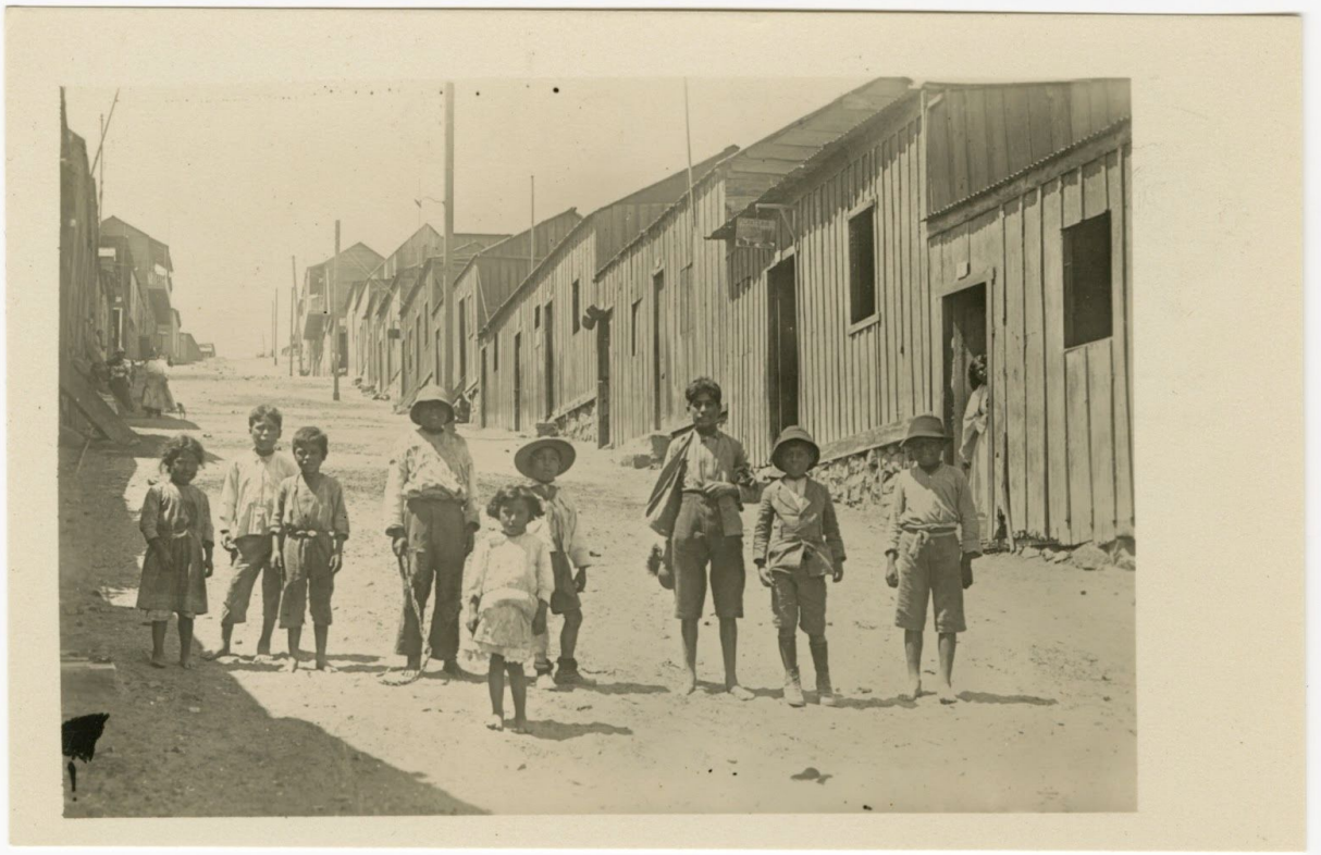
Niños y casas en Mollendo