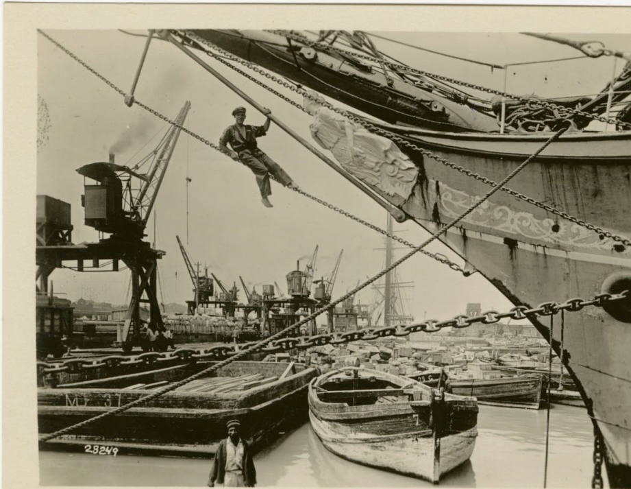
El puerto del Callao

Las postales ofrecen una perspectiva única del desarrollo del Perú en un centro económico moderno, listo para los negocios y el turismo, y al mismo tiempo revelando la tradición cultural. Características típicas en las fotografías que destacan la modernización del Perú incluyen las siguientes: edificios religiosos, comerciales y federales; temas cotidianos en el entorno urbano (paisajes urbanos, mercados, personas locales, etc.); e la industria, particularmente la fundición de cobre, el tejido y la exportación de materiales. Algunas características que representan el patrimonio natural y cultural son las siguientes: ruinas incas; el medio ambiente, como el océano salpicado de barcos y fundiciones de metales enclavadas en las montañas áridas; y animales, principalmente llamas ambulando por las calles o montañas.