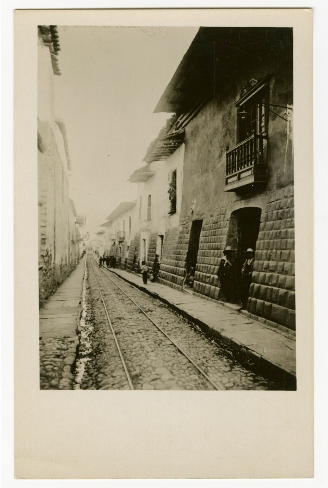
Fundaciones incas en casas coloniales