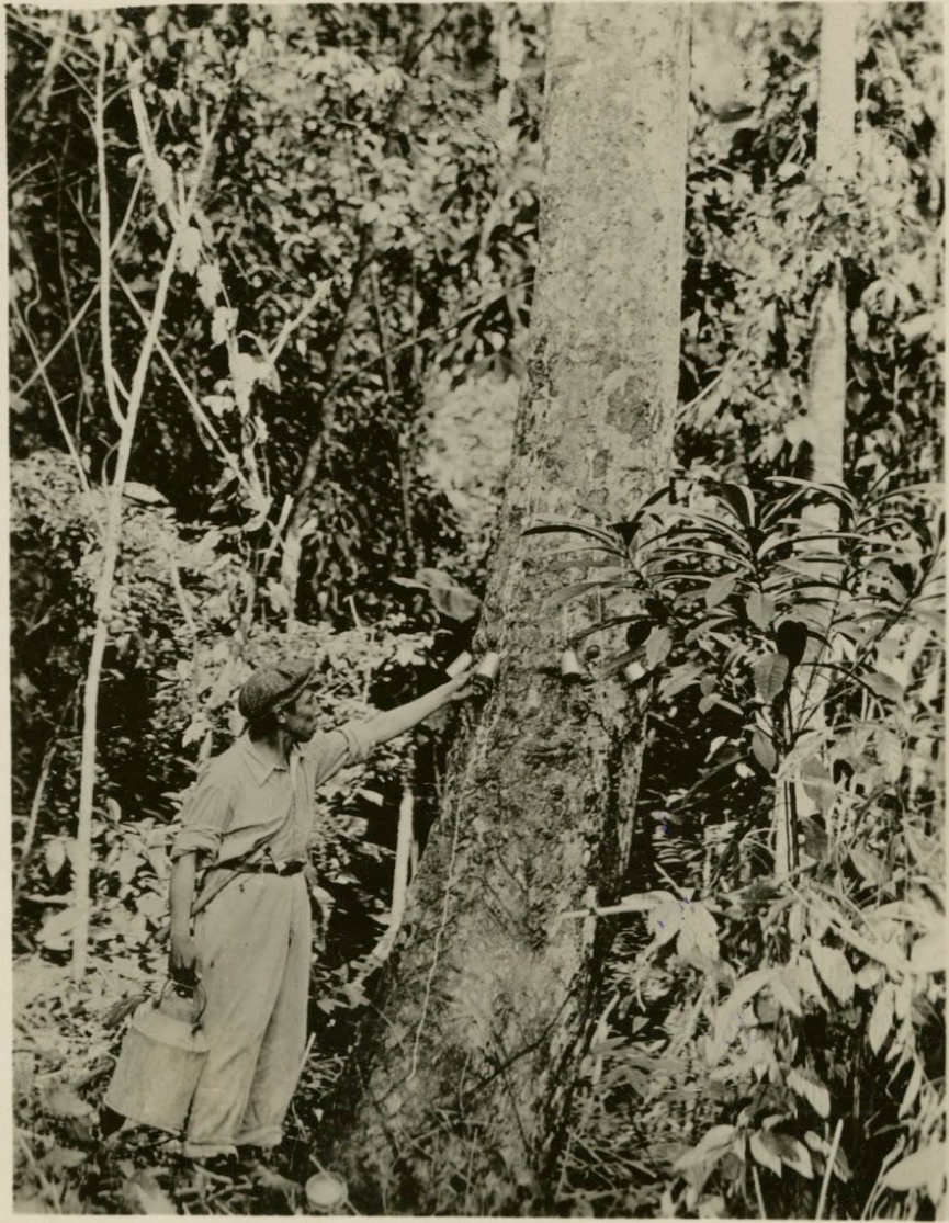
Extracción de caucho