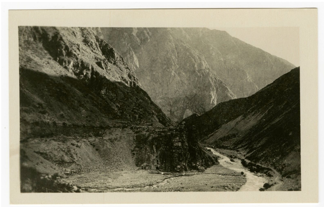
Una vista de un cañón desde el ferrocarril Oroyo

Estos recordatorios visuales de lo moderno, pasado y permanente refuerzan la idea de que la modernización puede transformar el Perú, pero no puede ocultar completamente su pasado. La coexistencia del antiguo y moderno Perú continúa revelándose en cada postal.