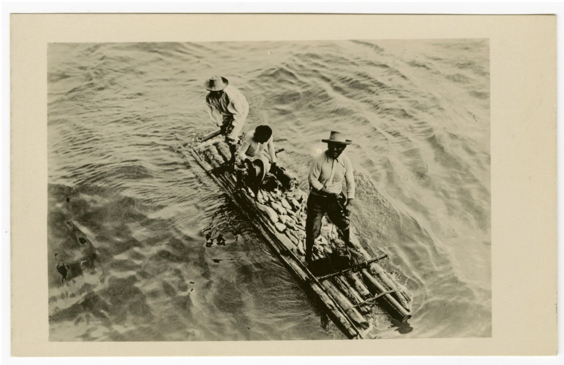
Pescadores en Payta

Aunque la modernización del Perú es más prominente en las postales, todavía se pueden encontrar rastros de las identidades tradicionales y nativas del Perú. Las más reconocibles son las ruinas incas de Cuzco, que aún conserva su estatus como la antigua capital del Perú, ya que fue el sitio del trono inca alrededor de los siglos XV y XVI. Algunas imágenes de Cuzco muestran la fusión de los muros incas en las estructuras de la ciudad moderna, un símbolo impresionante del antiguo y moderno Perú.