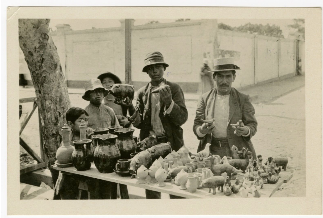
Vendedores de cerámica en un mercado de Lima

Estos recordatorios visuales de lo moderno, pasado y permanente refuerzan la idea de que la modernización puede transformar el Perú, pero no puede ocultar completamente su pasado. La coexistencia del antiguo y moderno Perú continúa revelándose en cada postal.