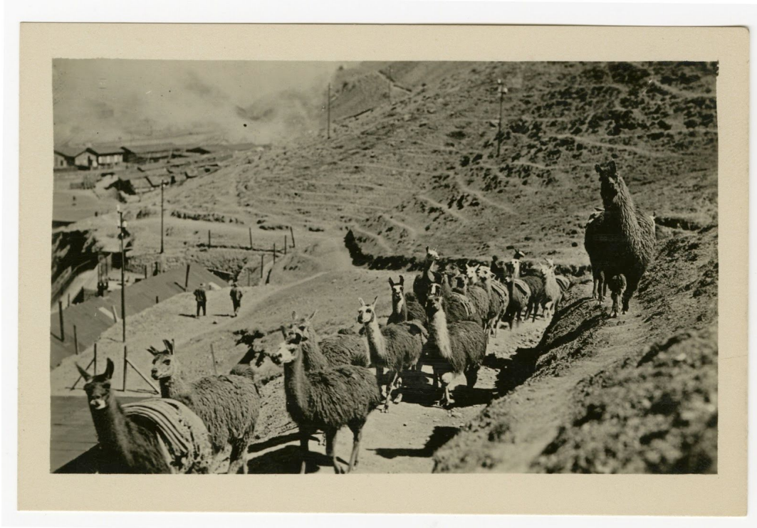
Tren de llamas en las montañas

En términos de animales y la naturaleza, otra imagen reconocible es la llama. Las postales de Lima, Casapalca y otros lugares muestran llamas y alpacas ambulando por las montañas, las calles e incluso un hotel. El terreno físico, una parte permanente del Perú, es el sujeto y el fondo en ciertas postales. Las colinas áridas a las fueras de las ciudades, las montañas ondulantes que abrazan las fundiciones y los ferrocarriles, las vistas panorámicas de la costa rocosa en Mollendo y el entorno oceánico en Payta y El Callao ayudan a los observadores de estas postales a imaginar el Perú en su entorno natural y ubicación física.