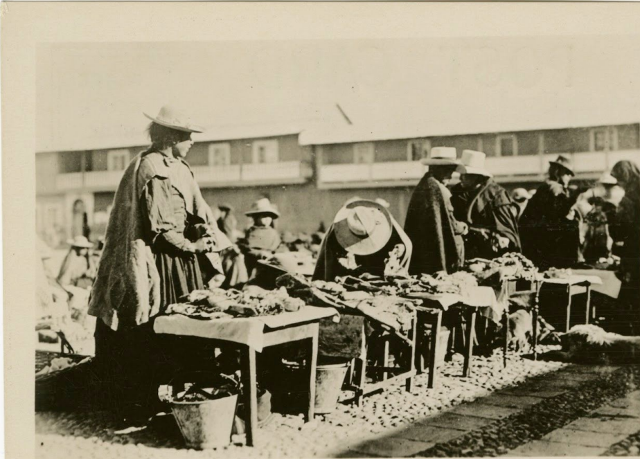
Un mercado en Juliaca

La Colección de Postales de la Hispanic Society of America consta de una serie de postales de países latinoamericanos y Brazil. Publicadas entre 1921 y 1928, las fotografías en blanco y negro documentan arquitectura, paisajes, la vida urbana cotidiana, industrias locales, y el entorno cultural y natural de cada país representado. Esta exhibición destaca más de 60 postales de la serie Perú, que recientemente se utilizó para ayudar a contextualizar cerámicas peruanas estudiadas en el curso de “Arte y Arqueología del Perú” .