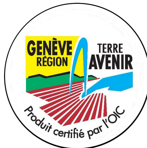
Figure 2 : Logo du label GRTA.

mesure tout comme d'autres initiatives s'inscrit dans le cadre des objectifs de la Loi genevoise sur la promotion de l'agriculture qui vise à « promouvoir une agriculture rémunératrice (...) respectueuse de l'environnement et répondant aux normes sociales et aux besoins du marché et de la population » (Art. 1, al. 1, Loi sur la Promotion de l'Agriculture, LPromAgr, 2004) et à « favoriser les liens entre ville et campagne dans une perspective de plus grande proximité » (Art. 1, al. 2).