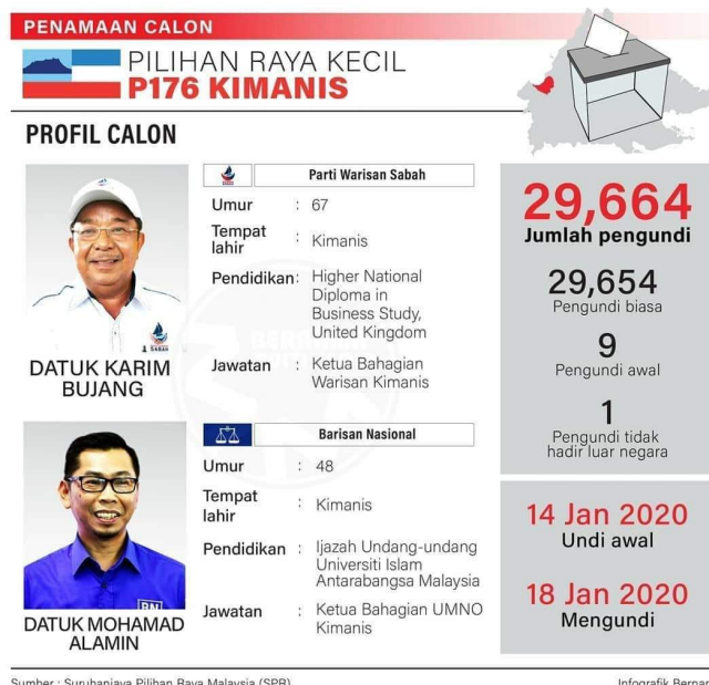
Rajah 1: Biodata Calon PRK Kimanis

Penamaan Calon pada 4hb Januari 2020 di Dewan Datuk Seri Panglima Dun Banir di Beaufort menyaksikan pertembungan satu lawan satu antara Datuk Karim Bujang (Warisan) dengan Datuk Mohamad Hj. Alamin (Barisan Nasional). Kehadiran ramai ahli parti-parti komponen Pakatan Harapan (PH) dan Barisan Nasional memperlihatkan sokongan yang padu bagi menjayakan kempen Pilihanraya Kecil Kimanis (PRK) P176 Kimanis ini ( lihat gambarajah 1 ).