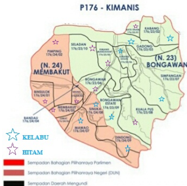
Rajah 2: Peta Lokasi Pusat Daerah Mengundi (PDM) di P176 Kimanis

Dari aspek semangat dan sokongan pengundi pula, gambaran awal tentang aura pengundian di lapangan menunjukkan sambutan kurang memberangsangkan dalam kalangan pengundi di Parlimen Kimanis terutama di Pusat-Pusat Daerah Mengundi (PDM) yang terletak di kawasan agak jauh dari pekan Bongawan dan pekan Membakut. Bilangan pengundi yang keluar agak kurang pada sekitar jam 10 pagi di beberapa Pusat Mengundi utama seperti di Sek. Keb. Kimanis sebagai Pusat Mengundi bagi calon Parti Warisan begitu juga di Sek. Keb Binsulok yang dilihat sebagai 'kawasan hitam dan kelabu' kepada pihak Parti Warisan dan berpotensi menentukan pemenang kepada BN seperti dalam PRU14 dan PRU13 yang lalu ( lihat gambarajah 2 ).