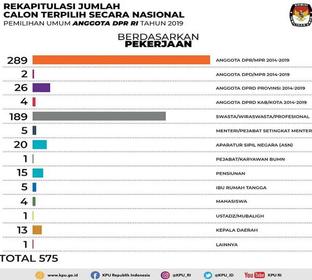
Gambar 2: Ikhtisar Latar Belakang Pekerjaan Ahli Parlimen 2019-2024.

Sumber: https://infopemilu.kpu.go.id/pileg2019