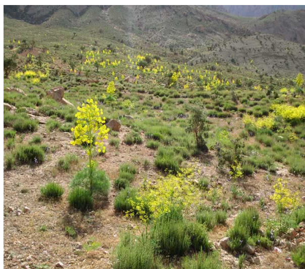
شکل ۱. تصویر پراکنش تیپ غالب گیاهان ناحیه جویبار کرمان از خانواده چتریان

نتایج جالب و گاهی غیر معمول نیز در استفاده بومی گیاهان مورد تحقیق در این مطالعه به دست آمد. به‌طور مثال، می‌توان به گیاه اهدرا ( Ephedra procera ) اشاره کرد که دارای اثرات آنتی‌باکتریال، آنتی‌اکسیدانت و ضدقارچ می‌باشد (۲۰، ۲۱). این گیاه در این منطقه مصرف صنعتی جهت تهیه چرم دارد که با توجه به تانن زیاد این گیاه قابل توجهی می‌باشد.