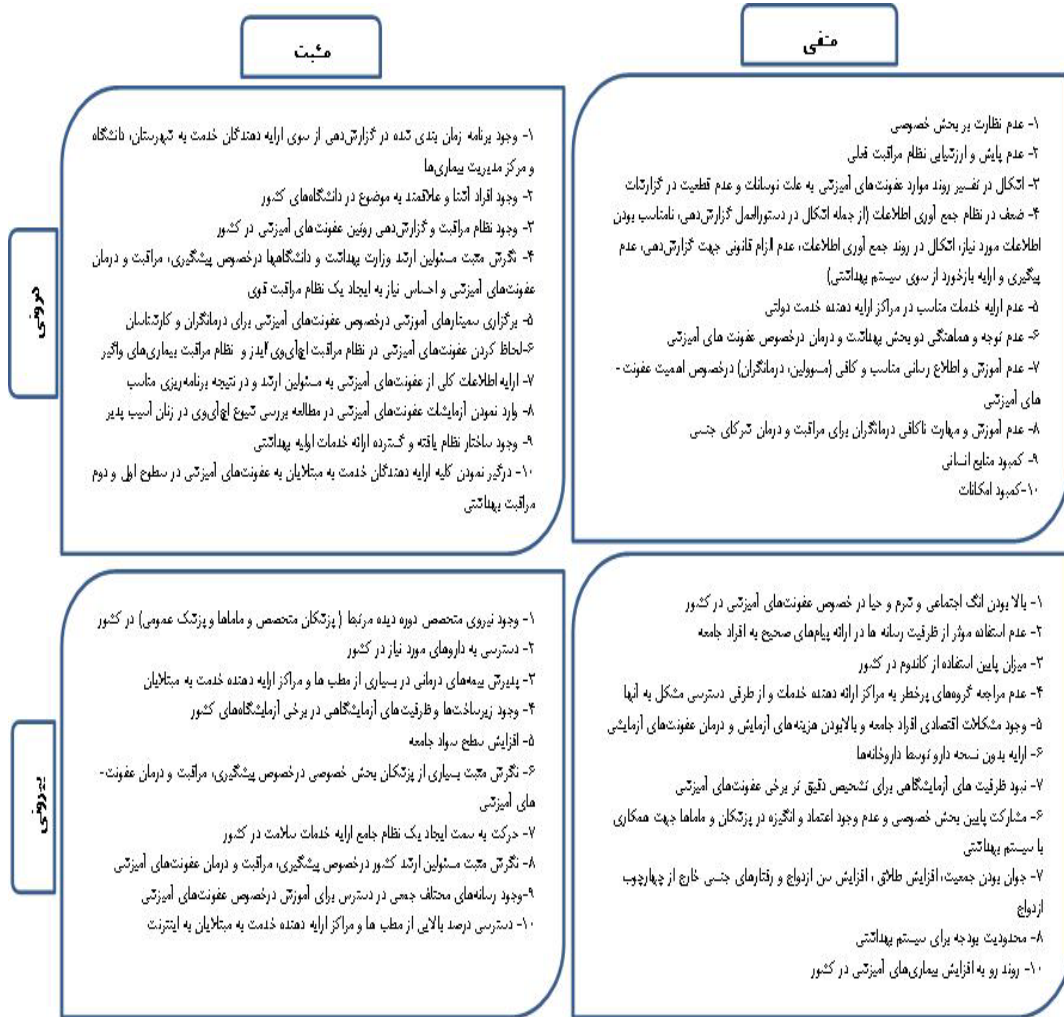
شکل ۲: چارت رتبه‌بندی نقاط ضعف و قوت و تهدیدها و فرصت‌های مرتبط با عفونت‌های آمیزشی در ایران

نقاط ضعف و قوت، تهدیدها و فرصت‌های مرتبط با عفونت‌های آمیزشی بر اساس جمع امتیازات کسب شده از سوی کارشناسان رتبه‌بندی شدند (شکل ۲). در نهایت وجود برنامه زمان‌بندی شده در گزارش-دهی با امتیاز مثبت ۳۳۹ (۳۴۷-۲۱۲) به‌عنوان مهم-ترین نقطه قوت، عدم استفاده مؤثر از ظرفیت رسانه‌ها در ارائه پیام‌های صحیح به افراد جامعه با امتیاز منفی ۳۰۵ (۳۲۱-۱۹۸) به‌عنوان مهم‌ترین نقطه ضعف