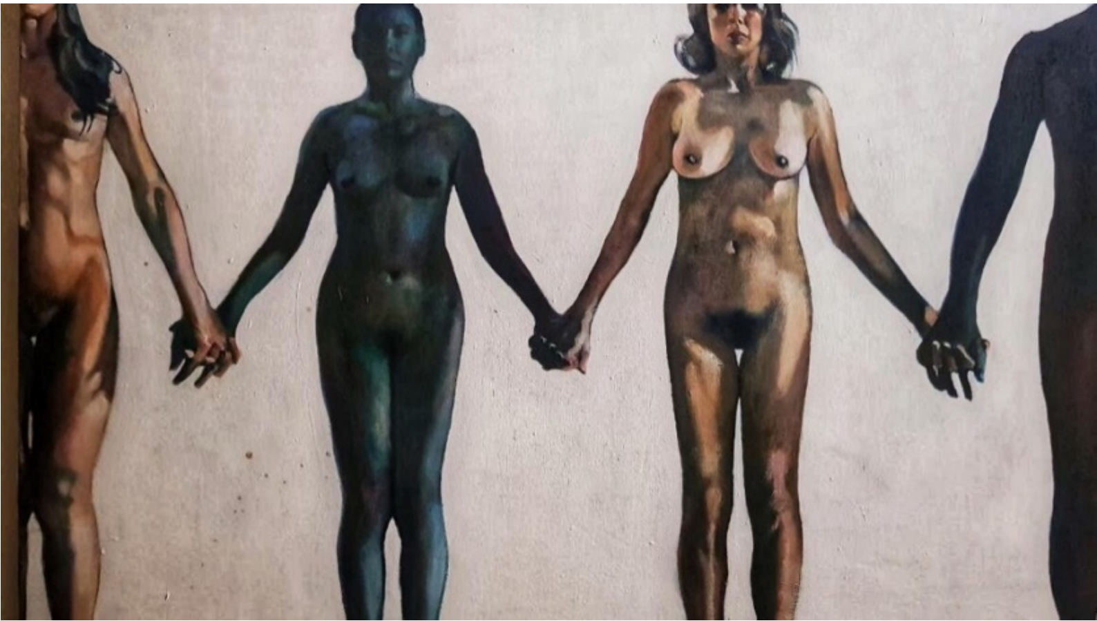
Figura 8. Perdidos pero tomados de la mano , de Lidia Cáliz. (Tegucigalpa, 2005).

Otros artistas contemporáneos que intervienen en espacios públicos son: