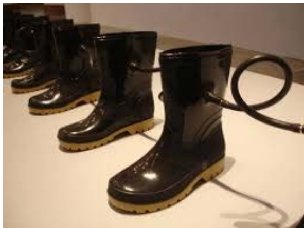
Figura 6. Autopoiesis I , de Adán Vallecillo. [Fotografía de Adán Vallecillo]. (Museo para la Identidad Nacional, Tegucigalpa, 2008). Archivos fotográficos del autor.