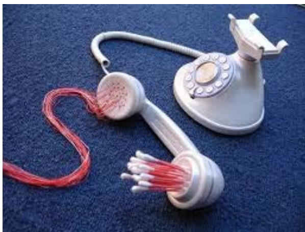
Figura 7. [Fotografía de Adán Vallecillo]. (Tegucigalpa, 2005). Archivos fotográficos del autor. Asepsiófono , de Adán Vallecillo.