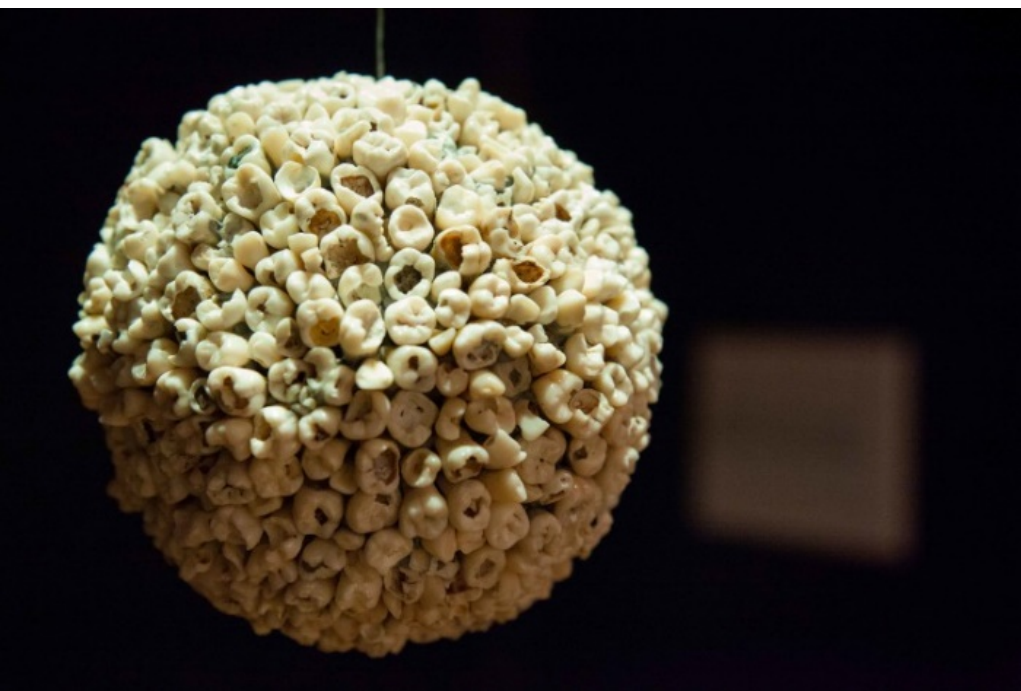
Figura 2. Alboroto , de Adán Vallecillo. [Fotografía de Adán Vallecillo]. (Museo para la Identidad Nacional, Tegucigalpa, 2015). Archivos fotográficos del autor.