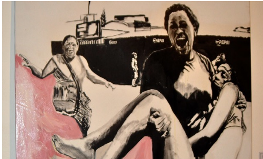
Figura 4. Honduras Bajo el Suelo , de Federico Rosa Suazo. [Fotografía de Federico Rosa Suazo]. (Museo de la Identidad Nacional, Tegucigalpa, 2017). Archivos fotográficos propios.