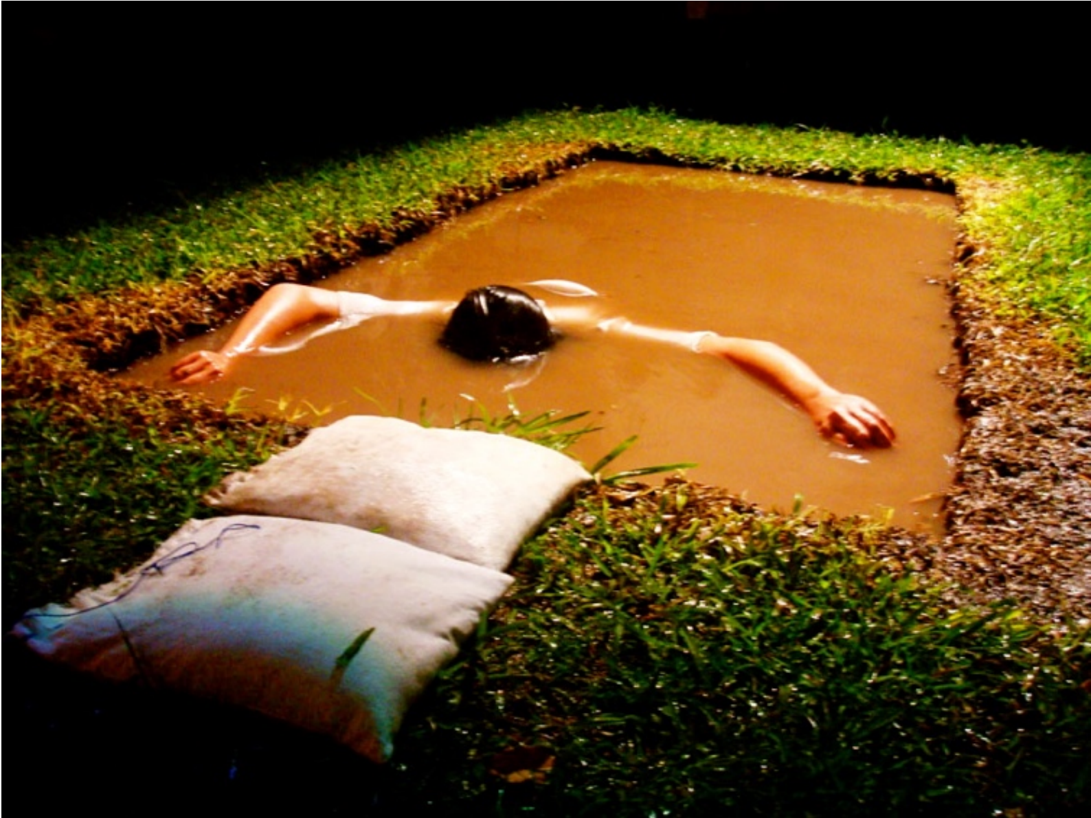
Figura 5. Alegoría de un país que no pudo ser , de Jorge Oquelí. (Galería Nacional de Arte, Tegucigalpa, 2010). De la colección de la III bienal de Honduras.