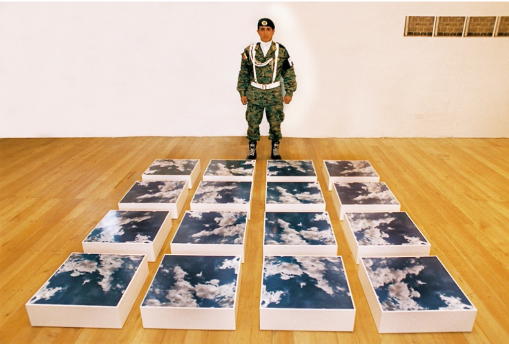
Figura 1. Nubes para ser resguardadas , de Gabriel Galeano. [Fotografía de Gabriel Galeano]. (Mujeres Unidas en las Artes, Honduras 2009). Archivos fotográficos del autor.