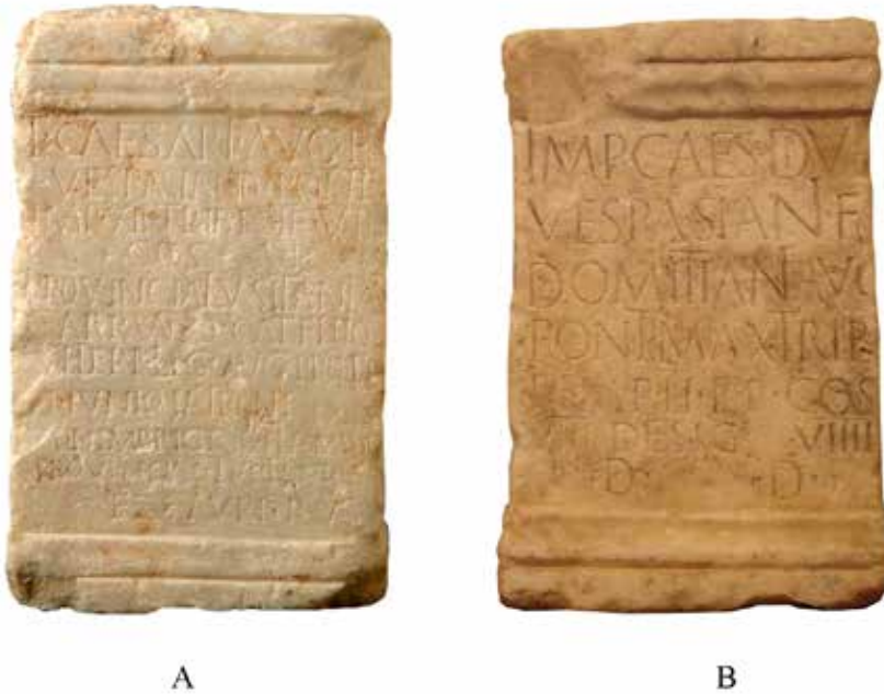
Figura 4. A. Ara dedicada a Tito en Augusta Emerita (Mérida, Badajoz). B. Homenaje a Domiciano procedente de Mirobriga (Ciudad Rodrigo, Salamanca). En ambos casos, se trata de dos pequeñas ámulas, que probablemente sirvieron de base para la colocación de un busto del emperador de pequeño formato.

cada a Tito (77 d. C.) 29 (fig. 4A). Esto llevaría a pensar que dicho homenaje se realizó durante el principado de Domiciano. Sin embargo, no puede descartarse que fuese erigido en un momento anterior, durante los reinados de Vespasiano o de Tito, como sucede en el caso de Herculaneum .