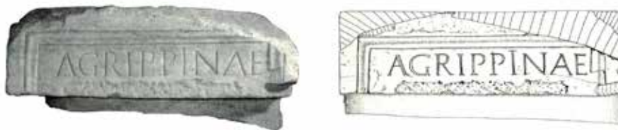
Figura 3. Baza de un pedestal de estatua en honor de Agrippina en Augusta Emerita . Fotografía del MNAR y dibujo de N. Röring. En la l. 2, la pieza ha sufrido la damnatio memoriae , exactamente igual que en el caso de la presente inscripción dedicada a Domicia. N. Röring y W. Trillmich identificaron al final de la l.2 el ápice de una -i longa . Esto les llevó a restituir el contenido eliminado como [[mat(er) · August]]i (“Agrippina y la Concordia Augusti: elementos para la interpretación del “foro provincial” de la Colonia Augusta Emerita”, 275-29, lám. 1.a, fig. 1a).

no sabemos el tamaño de las letras en la l. 2, por lo que no podemos establecer ningún tipo de cálculo. En base a todo ello, se pueden plantear las diversas restituciones posibles: