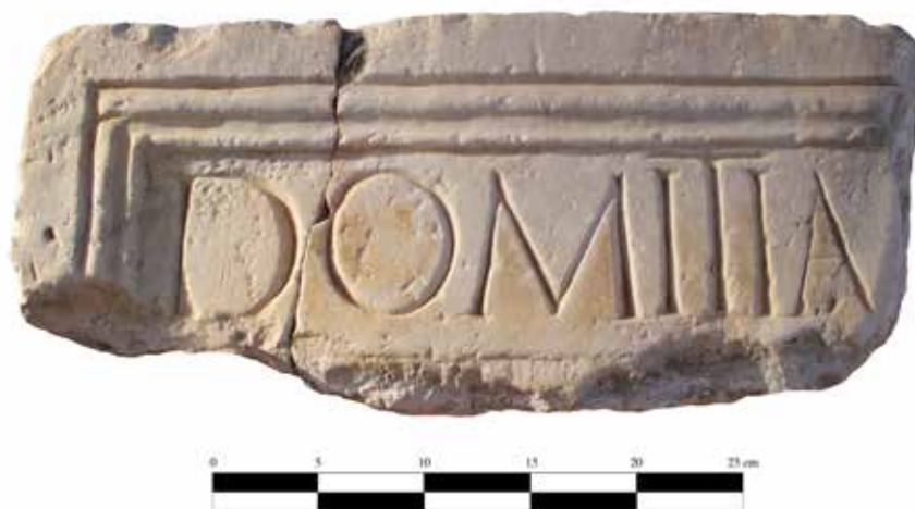
Figura 1. Visión frontal de la inscripción. Al comienzo de la l. 2, debajo del nombre de Domicia, se constata la presencia de una damnatio memoriae .

en los homenajes públicos 14 . No obstante, su titulación oficial podía completarse con la incorporación de la referencia explícita a Domiciano. Fue la propaganda oficial la encargada de crear y difundir esta fórmula. En las emisiones domiceanas la emperatriz es presentada como Domitia Augusta Imperatoris Domitiani 15 . Esta titulación está presente en algunas inscripciones imperiales, como en Puteoli 16 . Algo similar registramos en la ciudad griega de Brykous , donde se la homenajea como Dea Domitia Augusta Imperatoris Caesaris Domitiani Vespasiani f. 17 . Por lo general, en las inscripciones procedentes de Oriente, además del título extraoficial de Dea 18 , constatamos un desarrollo más completo de la secuencia ono-