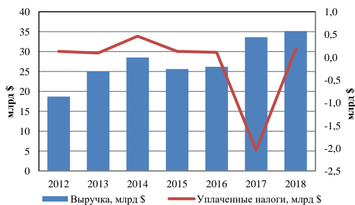
Рис. 3 Анализ выручки и уплаченных налогов

В периоде с 2012 по 2014 год, с 2015 по 2018 год выручка предприятия возрастала (рис. 3). Прослеживается прямая зависимость уплаченных налогов от выручки. Точкой минимума уплаченных налогов стал 2017 год, компания получила компенсацию в размере 2 млрд $. Эта сумма была обусловлена принятием в США «Закона о сокращении налогов и рабочих мест» 22 декабря 2017 года [1], который декларировал снижение федеральной ставки корпоративного подоходного налога с 35% до 21%.