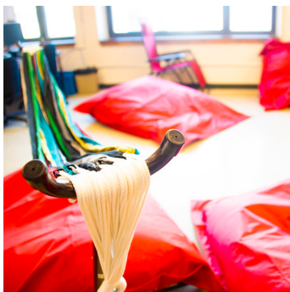
Photo 1 - Des hamacs et des Bean bags (bibliothèque du Collège Lionel-Groulx)

L'espace de la bibliothèque et sa mise en valeur par des vitrines ou des expositions arrivent en tête des services offerts dans les bibliothèques collégiales (voir Tableau 3). Plus de la moitié des répondants exploitent le lieu « bibliothèque » pour y organiser des activités relaxantes ou intégrer du matériel pour la détente, comme les Bean bags et les hamacs au Collège Lionel-Groulx ou au Cégep de Matane, les chaises Adirondacks au Cégep de Saint-Jean-sur-Richelieu dans une zone « Comme au chalet ». Au Cégep de Chicoutimi, des coussins et des poufs délimitent une « zone Zen » aménagée en collaboration avec l'Association générale des étudiantes et des étudiants (AGEECC). « On y