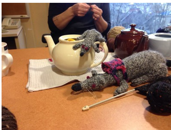
Photo 2 - Activité de tricot à la bibliothèque du Cégep du Vieux-Montréal