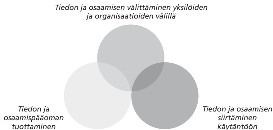
KUVIO 2. Avainprosessit (Husso 2004, 45; Ritsilä & Haukka 2003, 11 pohjalta)

Sekä kehittämishankkeiden aikana että niiden päättymisen jälkeen on tärkeää kiinnittää huomiota avainprosesseihin, jotka mahdollistavat kehitettyjen toimintamallien ja käytäntöjen jatkumisen, kehittymisen ja käytäntöön vakiinnuttamisen. Avainprosessit on mahdollista tiivistää kuvioksi, joka muodostuu kolmesta osittain päällekkäisestä toisiinsa liittyvästä osa-alueesta: tiedon ja osaamispääoman tuottamisesta, tiedon ja osaamisen välittämisestä sekä tiedon ja osaamisen käytäntöön siirtämisestä (ks. kuvio 2 alla).