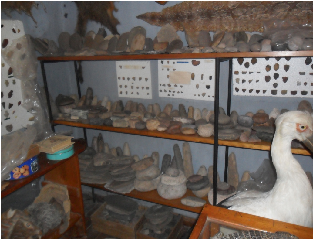
Figura 3. Piezas de la colección Cinquini.