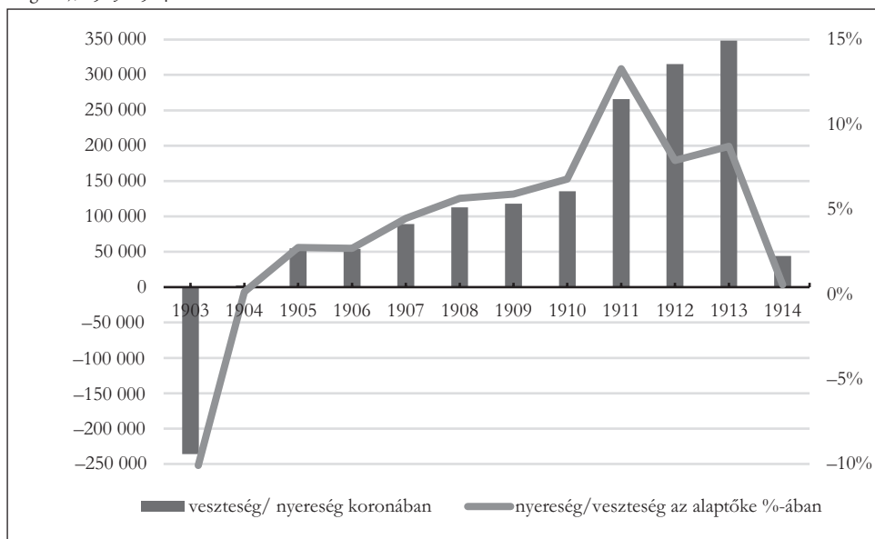
1. ábra. Az MSSM éves vesztesége/nyeresége koronában (oszlopdiagram) és az alaptőke százalékában kifejezve (vonal-diagram), 1903–1914