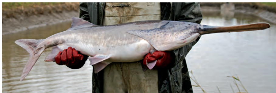
4.7. ábra. Lapátorrú tok ( Polyodon spathula ) a HAKI génbankjából

A Dunában, illetve mellékfolyóinak vízgyűjtőjén napjainkig két idegenhonos tokféle megjelenéséről van tudomásunk. Az észak-amerikai (Mississippi-vízrendszer) eredetű, eredeti elterjedési területén sérülékeny, csökkenő állományméretet mutató lapátorrú tok ( Polyodon spathula ) (4.7 ábra) első dunai észlelési adata 2000-ból a bulgáriai Pogarevo (426 fkm) térségéből származik. Ezt követően a 2006-os évben Szerbiában (Prahova térsége, 861 fkm) két egyedet, majd 2011-ben már a magyar szakaszon is két egyedet (Sződliget – 1675 fkm és Báta - 1465 fkm) fogtak. Ezen egyedek nagy valószínűséggel halgazdaságokból szöktek ki, a faj természetesvízi szaporodására egyelőre nincs bizonyíték.