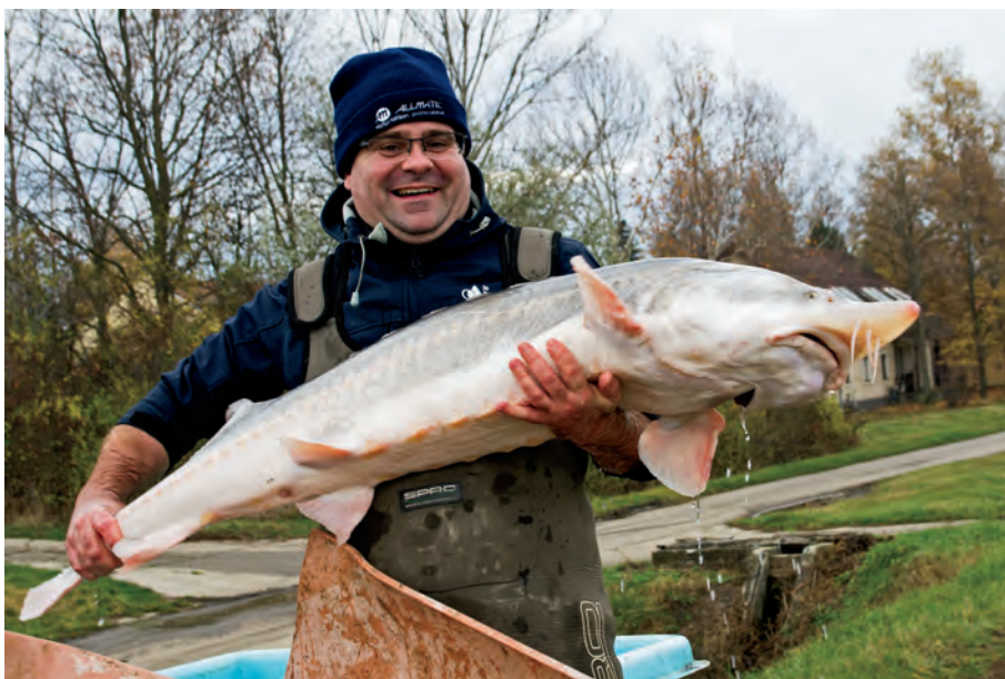
4.1. ábra. Viza ( Huso huso ) a HAKI génbankjából

beszerzése jelenti a fő problémát. A magyarországi Duna-szakaszon a homokméggyi telepről származó, 2010-ben telepített előnevelt vizák közül az első jelölt példányt 10 nappal a kihelyezést követően a Vaskapunál fogták vissza, majd nem sokkal később a Deltában is sikerült jelölt halat visszafogni. Ez egyrészt örömteli, mert bizonyítja, hogy a Vaskapu-vízlépcsőrendszer – ahogy az jellegéből adódóan várható is volt – folyásirányban nem jelent migrációs barriert, másrészt viszont visszajutásuk a hazai folyamszakaszra továbbra is szinte lehetetlen.