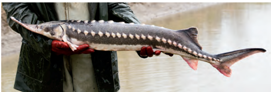
4.6. ábra. Sőregtok ( Acipenser stellatus ) a HAKI génbankjából

A sőregtok (4.6 ábra), bár soha nem volt gyakori a Duna középső és felső szakaszán, rendszeresen előfordult. Szaporodási vándorlásuk során csapatai legtöbbször Pozsony magasságáig (a Tiszán Tokajig), kivételes esetben a bajorországi Straubing térségébe szaladtak fel. Jelentős állománya az Al-Dunán, illetve az oda torkolló nagyobb folyókban (Prut, Olt, Szeret és Zsil) talált ívóhelyet. A faj obligát anadrom, édesvízi életmódra tért populációi nem ismertek, de a vágótok esetében leírt vándorlási típusok (vernális, hyemális) itt is megtalálhatók. A Duna hazai szakaszán legutoljára 1965-ben Mohácsnál fogták. A Vaskapu I. üzembe helyezése (1970) után a szerbiai folyószakaszon még szórványosan, de előfordult a halászsákmányban, azonban a Vaskapu II. átadása után elterjedése a vízlépcsők alatti szakaszra, az Al-Dunára korlátozódik, ahol a halászfogásban is jelentős: a folyó bolgár szakaszán 1945 és 1949 között évente átlagosan 14,1 tonnát, 1960 és 1974 között átlag 3 tonnát, míg 1995 és 2002 között 1,7 tonnát fogtak.