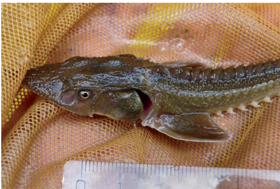
4.9. ábra. Fiatal tokhibrid ( Acipenser naccarii x Acipenser baerii ) a Dunából

Ahogy azt már korábban említettük a tokfélék esetén gyakori a természetes hibridizáció, a hibrid utódok rendszerint életképesek. Ezt kihasználva a haltermelő gazdaságokban számos hibriddel kísérleteznek. Egy ilyen gazdaságból kerülhetett a folyóba a 3 db növendék adriai és lénai tok hibrid