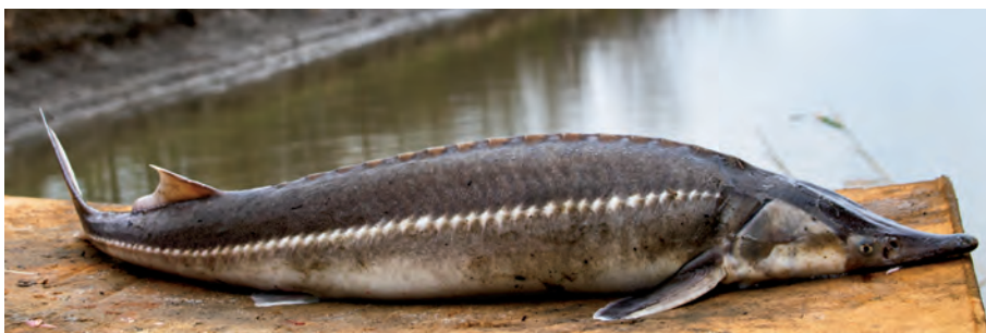
4.3. ábra. Kecsege ( Acipenser ruthenus ) a HAKI génbankjából