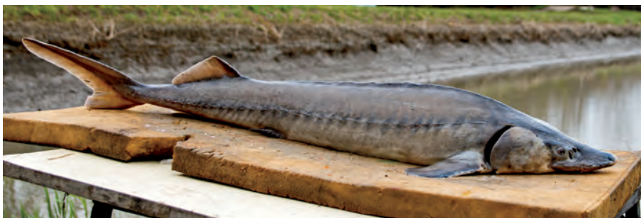
4.8. ábra. Lénai tok ( Acipenser baeri ) a HAKI génbankjából

ló természetes hibridizációt is. Ez utóbbi aggasztó információ nem csak a dunai kecsege, de valamennyi tokfaj állományának sorsát illetően is.