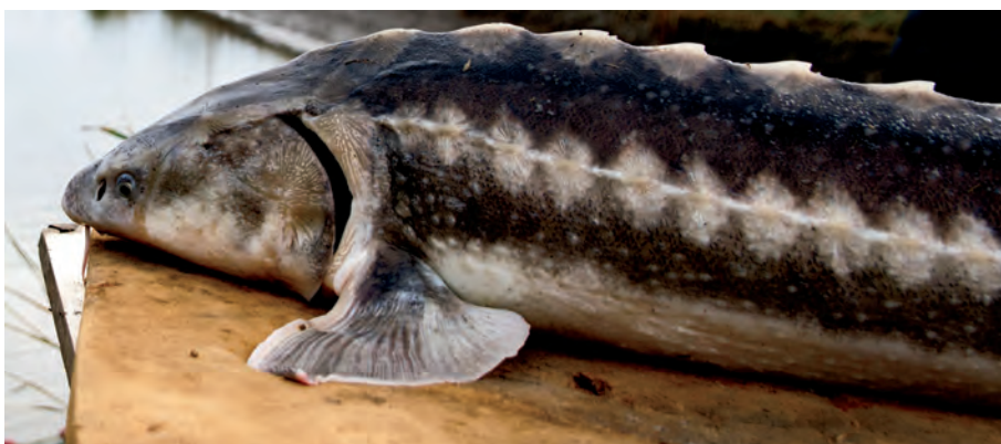
4.5. ábra. Vágótok ( Acipenser gueldenstaedti ) portré a HAKI génbankjából

Valaha a Duna-vízrendszer területi szempontból legelterjedtebb tokféléje volt. Fő szaporodóhelyei a Duna pozsonyi szakaszáig tartottak, de előfordulási adata ismert Regensburg térségéből is. A Közép-Duna nagyobb mellékfolyói közül szinte mindenhol megtalálható volt, így a Moravában, Vágban, a Tiszában, a Szamoson, de a Zagyvában is. Érdekes módon az Al-Duna mellékvízeibe (Olt, Zsil, Prut, Szeret) sokkal ritkábban úszott fel.