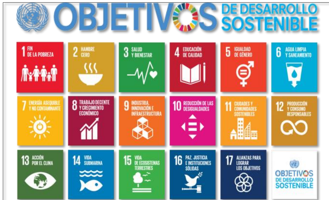
Imagen N° 2: Objetivos de Desarrollo Sostenible