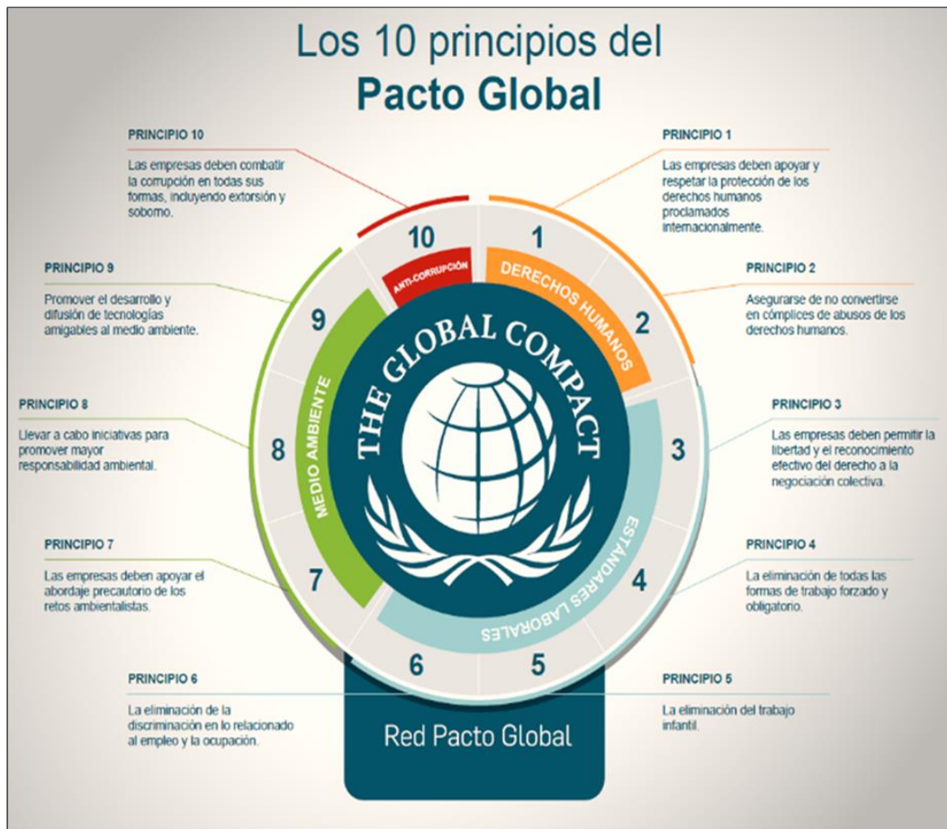
Imagen N° 1: Principios del Pacto Global