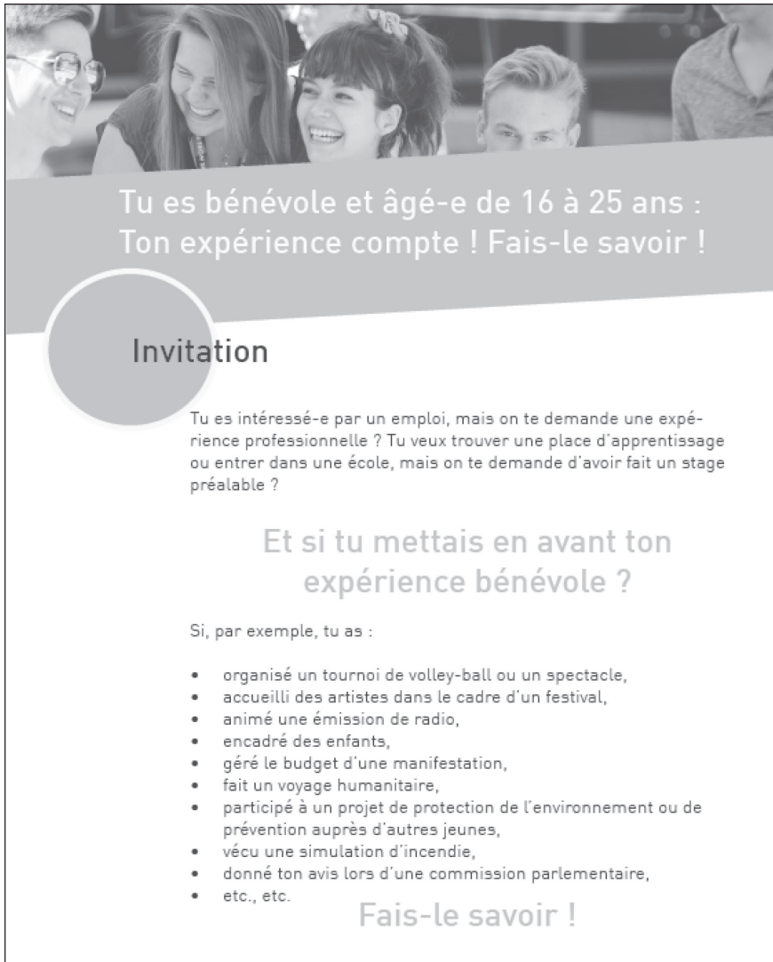
Figure 3: Flyer diffusé aux jeunes bénévoles

cadre associatif. Nous avons ensuite procédé à une mise en commun. Les compétences les plus fréquemment citées étaient transversales : travailler en équipe, gérer les conflits, communiquer, gérer des projets, faire preuve d'autonomie. Dans un second temps, nous avons demandé aux bénévoles de relier ces compétences transversales à des activités