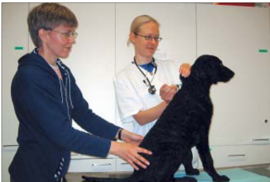
Rokottamisen yhteydessä tulee varautua anafylaksiaoireiden hoitoon

Kortisonista ja antihistamiinista ei ole apua anafylaktisen shokin akuutin vaiheen hoidossa. Sen sijaan ne ovat tärkeitä sekundaaristen välittäjäaineiden aiheuttamien myöhäsimpien reaktioiden estossa. Kortisoni ja antihistamiini saattavat pahentaa vasodilataatiota, joten niitä voi antaa vasta kun eläimen shokkitila on hoidettu.