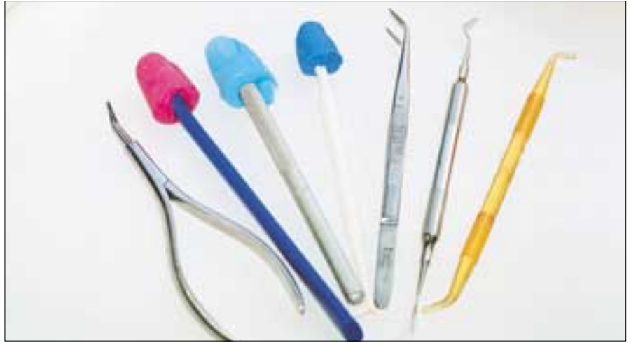
Erilaisia sormien korvikkeita, joiden avulla hammaslääkäri voi välttää kosketuksen muovimateriaaleihin.

Kurinalainen, yrityksen ja erehdyksen kautta tapahtunut ”no touch” tekniikkaan siirtyminen on vaatinut tiiviin parityöskentelyn lisäksi luonnollisesti myös taloudellista panostusta ja aikaa. Kun Jokela