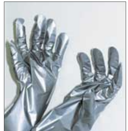
Kuvassa 4H-käsineet, jotka suojaavat kaikilta akrylaateilta neljän tunnin ajan.

Lääkelaitos on yhdessä sosiaali- ja terveysministeriön työsuojeluosaston, Työterveyslaitoksen, Turun aluetyöterveyslaitoksen ja alan ammattiliittojen kanssa laatinut sekä hammaslääkäreille että hammasteknikoille esitteet, joissa annetaan ohjeita muovityöskentelystä. Esitteet löytyvät Lääkelaitoksen kotisivuilta www.nam.fi . kohdassa Julkaisut – Laitejulkaisut.