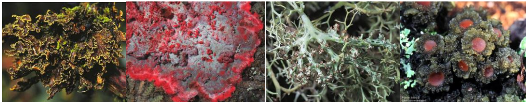
Figura 1. Líquenes del tipo crustáceo, foliáceo, fruticoso y gelatinoso respectivamente.

Son pioneros en la colonización de rocas, desintegrándolas para la formación de suelo, permitiendo el crecimiento de diversos tipos de vegetación rupícola o sexícola, musgos y ciertas plantas vasculares, jugando un papel importante en el ciclo de la materia en los ecosistemas. (Ramírez et al. , 2005) El desarrollo estructural de los líquenes esta intrínsecamente relacionado con la asociación entre los tejidos del hongo, que rodea al fotobionte, generando las formas de costra (crustáceo), hoja (foliáceo), de diminutos arbustos (fruticoso) y gelatinosos (Hawksworth et al. , 2000).