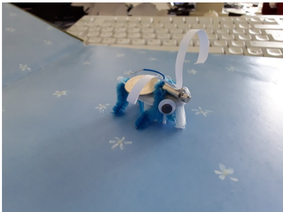
Abb. 1: Im Rahmen der MINT Förderung bauen die Kinder selbst Putzroboter

MINT Förderung: Im Rahmen der MINT Förderung werden naturwissenschaftliche und technische Themen in einzelnen Veranstaltungen und auf Anfrage auch für Schulen und Kindergärten behandelt und praktisch umgesetzt. Unter Einbezug des Sachbuchbestandes werden unter Anleitung von Frau Flecke beispielsweise Putzroboter, Krabbelroboter, eine Wetterstation, LED Lesezeichen, LED Armbänder und Solarboote selbst gebaut, hergestellt und Roboter programmiert. Das Ziel der Veranstaltungen ist, das naturwissenschaftliche und technische Verständnis der Kinder zu fördern, den Umgang mit digitalen Programmen und Medien zu erlernen, ein Verständnis für das Programmieren zu vermitteln und sich somit aktiv auf die fortschreitende Digitalisierung im privaten und wirtschaftlichen Bereich vorzubereiten.