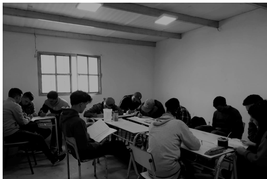
Encuentro N°10 – Taller de “Cultura y Expresión”