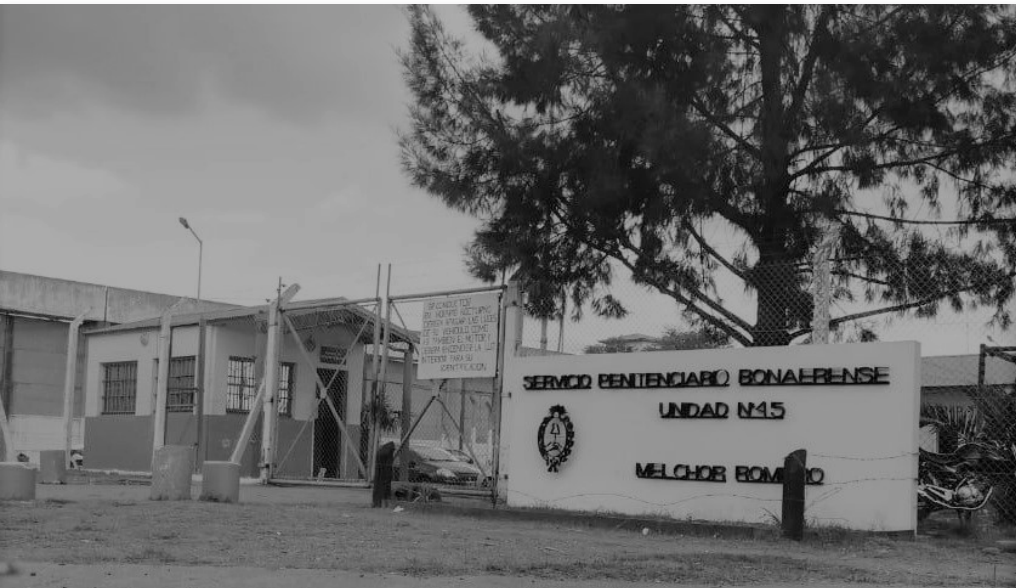
Unidad N°45 – Melchor Romero