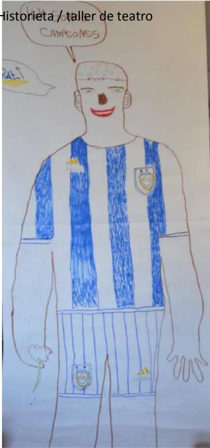
Historieta / taller de teatro