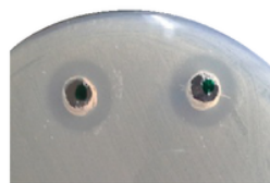
Gambar 1. Hasil uji aktivitas cairan kultur isolat P30.

Uji Aktivitas Cairan Kultur Isolat P301 terhadap S. aureus . Uji aktivitas cairan kultur isolat P301 terhadap S. aureus ditujukan untuk mengetahui ada tidaknya senyawa antibiotik dalam cairan kultur tersebut yang dapat menghambat pertumbuhan S. aureus . Uji dilakukan dengan metode sumuran yang merupakan salah satu metode difusi. Sebanyak 50 µL cairan kultur dimasukkan dalam media MHA yang telah ditanami bakteri S. aureus kemudian disimpan dalam kulkas selama 2 jam agar cairan kultur terdifusi kedalam media. Media kemudian di inkubasi selama 24 jam pada suhu 37 °C. Hasil penelitian menunjukkan adanya zona hambat (jernih) pada media dengan diameter 12,0 mm. Hasil uji aktivitas cairan kultur ini dapat dilihat pada Gambar 1. Zona hambat terbentuk karena senyawa antibiotik dalam cairan kultur berdifusi ke dalam agar dan menyebabkan tidak tumbuh atau terhambatnya pertumbuhan S. aureus . Hasil penelitian Ramadhan (7) terhadap potensi antibiotik isolat P301 dengan metode agar block menunjukkan penghambatan yang tinggi yaitu dengan zona hambatan 20,0 mm. Tujuan utama uji aktivitas cairan kultur pada penelitian ini adalah untuk mengetahui apakah cairan kultur yang dihasilkan menunjukkan aktivitas antibiotik terhadap S. aureus . Hal ini dilakukan karena kemampuan