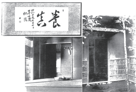
図 5 本山邸茶室と書「養眞」

濱寺の本山私邸は、旧私邸を建て直して 1929（昭和 4）年に竣工した。本山彦一の御孫である上杉康彦氏によれば、本山は藤田組支配人の時、南海電鉄の経営にも関与していた。南海電鉄は、明治 36 年に難波・和歌山間が開通したが、沿線のことを熟知していたという。前半生の赴任先を転々とする生活を終えて良地に定住し、各地に分散した一族をまとめる機会として、地の利の良い濱寺を選んだのだ、との示唆をいただいた。