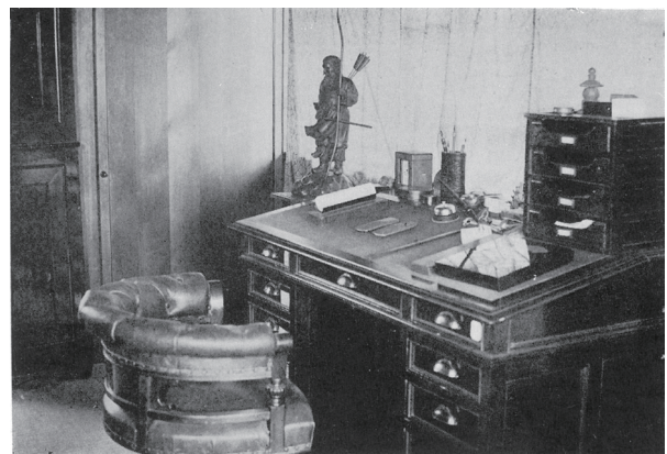
図 6 書斎机