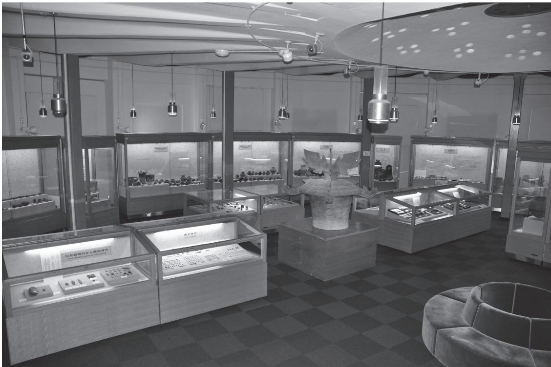
図 8 関西大学博物館常設展示室

末永雅雄の考古学研究室に設けられた考古学資料（陳列）室は、1974（昭和 49）年に岩崎記念館 4 階に移転して文学部の組織として関西大学文学部考古学等資料館となり、さらに 1985（昭和 60）年、旧図書館建物に移転・拡大し、1994（平成 6）年から大学図書館と同格の関西大学博物館となっている。