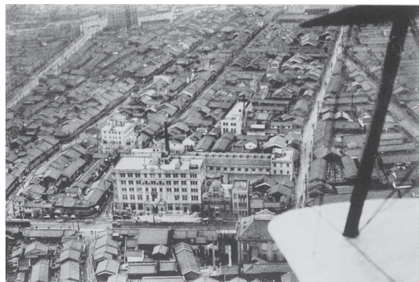
図3 大阪毎日新聞社社屋全景