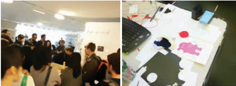
FOTO 4: Ejemplos de métodos de enseñanza del grupo High-Low Tech del MIT Media Lab de Boston, EEUU (Junio 2010).