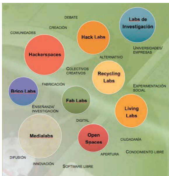
FOTO 1: Cartografía de clasificación de medialabs e iniciativas similares basado en el de www.tmplab.org (2010)

Según se muestra, éstas fluctúan entre laboratorios u organizaciones cuyas prioridades resultan, con la raíces comunes que antes comentábamos, más cercanas a una u otra vertiente: