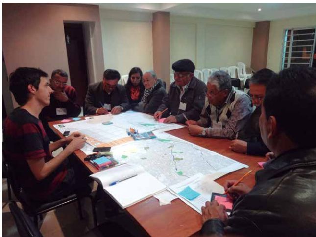
Talleres de participación ciudadana.