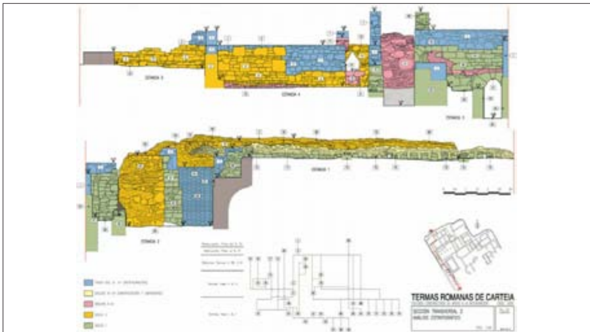
Figura 3. Termas romanas de Carteia. Sección transversal 2. Análisis estratigráfico.