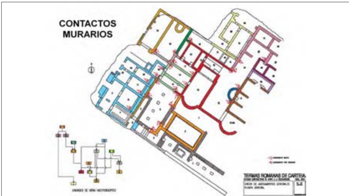
Figura 1. Termas romanas de Carteia. Orden de adosamientos generales. Planta general.