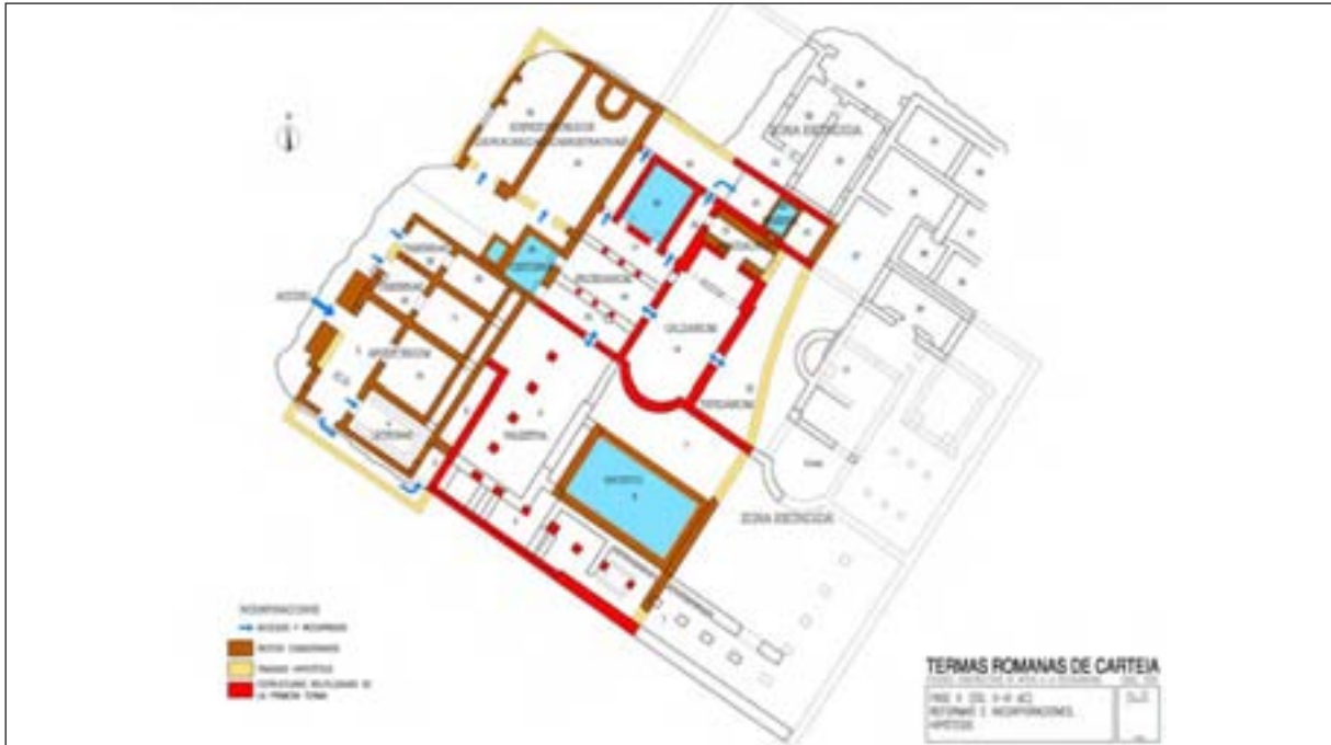
Figura 5. Termas romanas de Carteia. Fase II (Siglos I-II dC). Reformas e incorporaciones. Hipótesis.