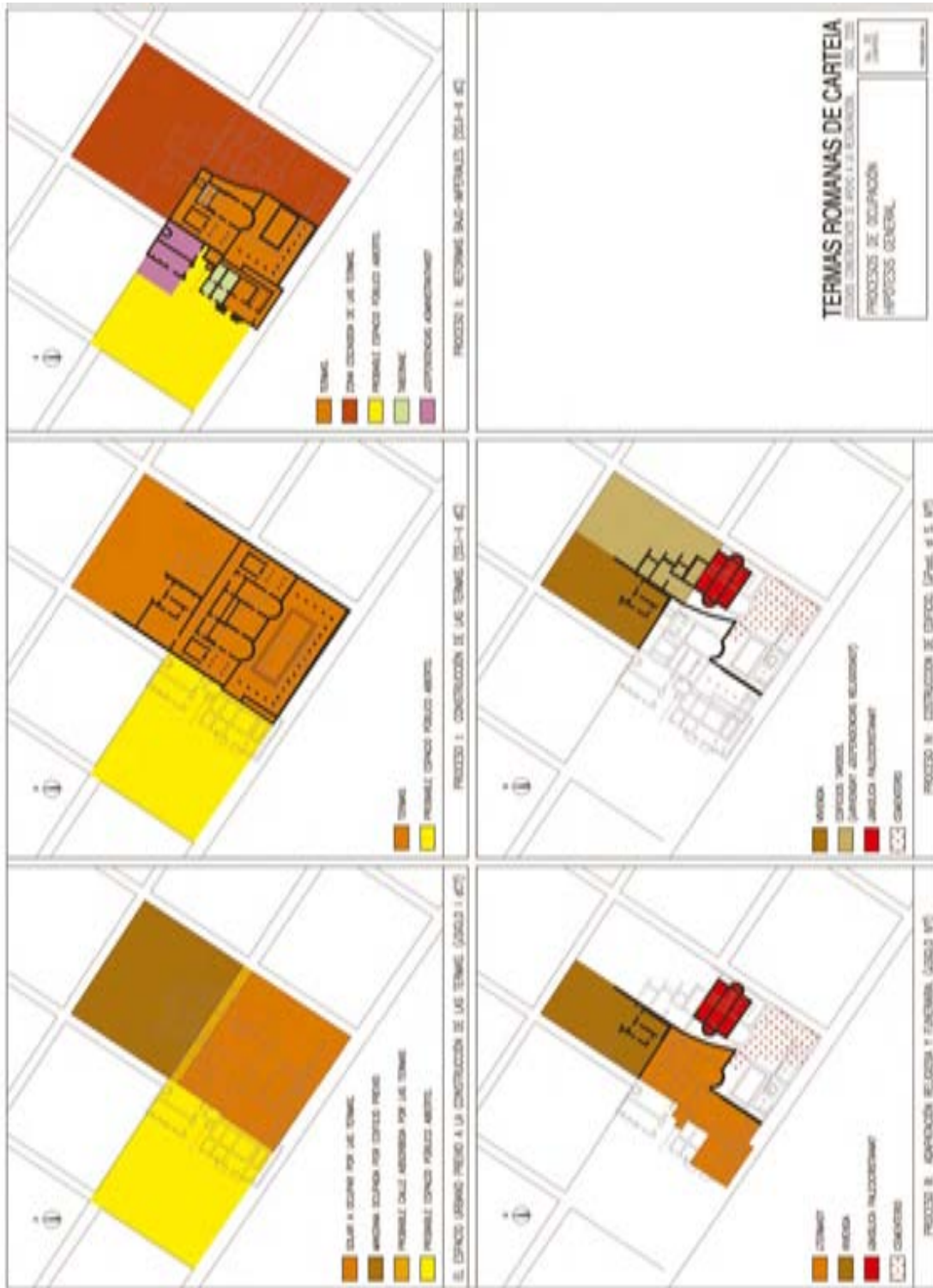
Figura 7. Termas romanas de Carteia. Procesos de ocupación. Hipótesis general.