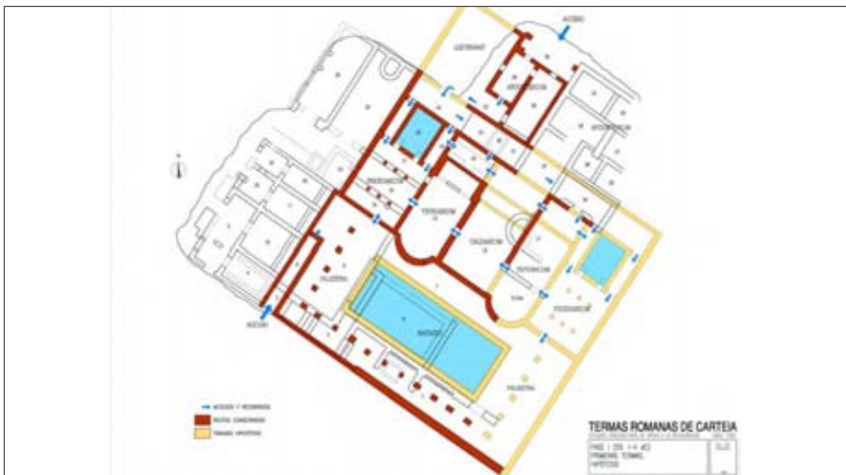
Figura 4. Termas romanas de Carteia. Fase I (Siglos I-II dC). Primeras termas. Hipótesis.