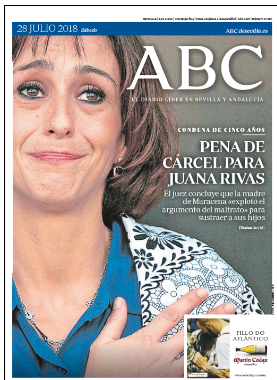
Figura 7: ABC el 28 de julio de 2018

No podía ser de otro modo, precisamente cuando los medios también “explotaron” el argumento del maltrato, generando con ello y alimentando el fuerte apoyo social hacia la figura de Juana Rivas.