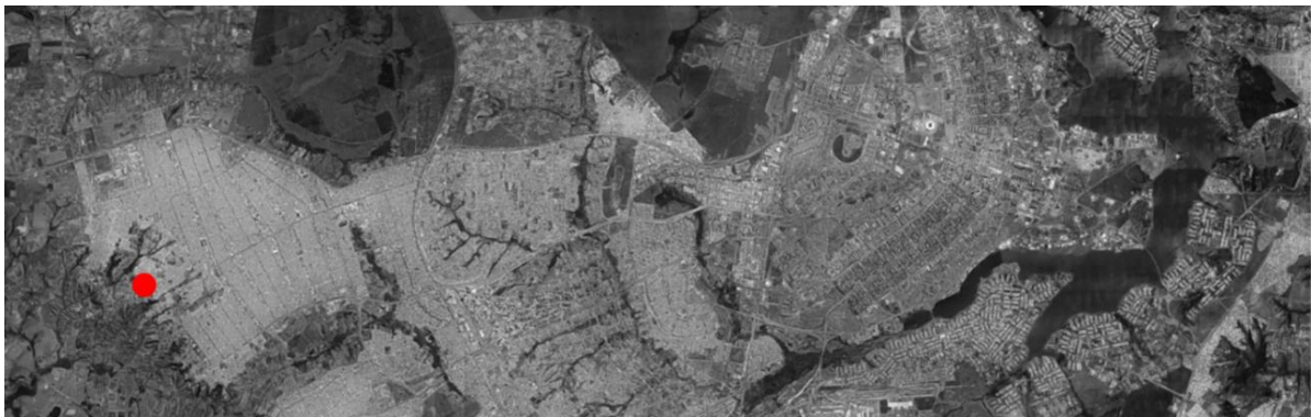
FIG.01: Sol Nascente no contexto do Distrito Federal.