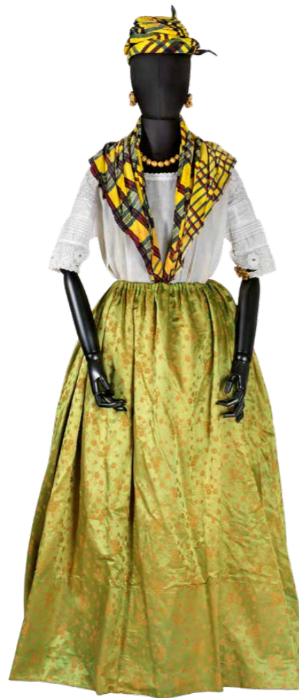
Fig.4 Bl.a. denne festkjole, som har tilhørt en sort barnepige, er ikke tidligere vist. Tørklædet af indisk bomuldsstof har fået gule tern påmalet i Vestindien efter tidens mode. Martinique, ca. 1860.

Der er mange stemmer at lytte til og meget at læse i udstillingen, og derfor er et af de væsentligste indretningsgreb flytbare sorte siddebømler. Sidde-