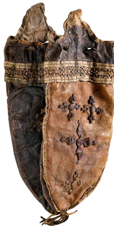
Fig.7 Skindpung syet i Vestgrønland. Syning af skindvarer til danskere og europæiske hvalfangere samt indsamling af edderdun var en populær indtægtskilde for de grønlandske kvinder. Således kunne de skabe sig en økonomi, der var mere uafhængig af mændenes fangst.

Skin purse sewn in West Greenland. Sewing skin articles for Danes and European whalers, like collecting eiderdown, was a popular source of income for Greenlandic women making them less economically dependent on the men's hunting.