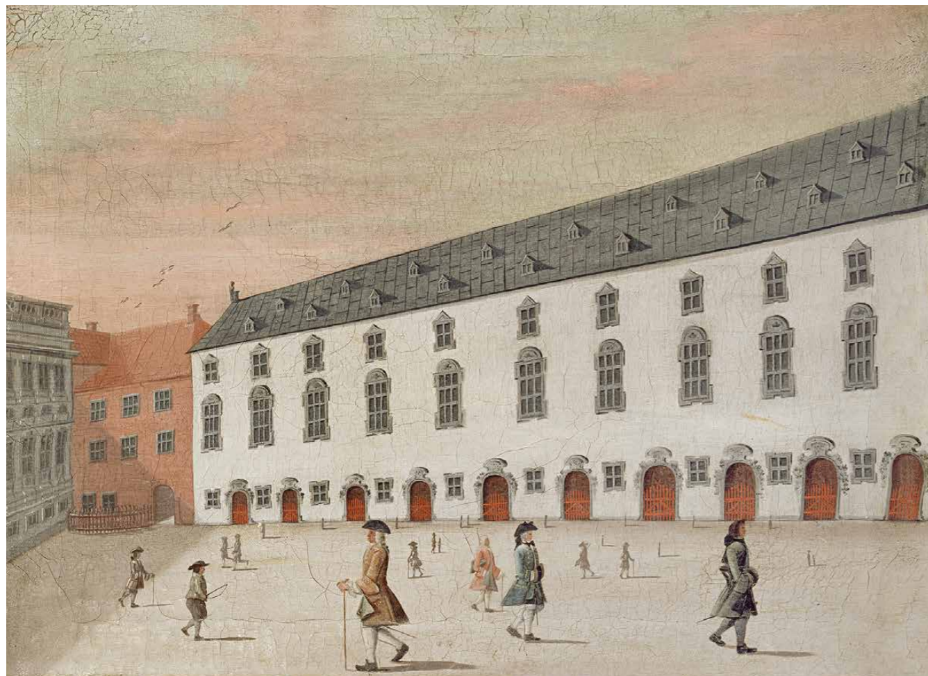
Fig.4 Kunstkammerbygningen fra c. 1680. Maleri fra 1749 af Rach & Eegberg.

The building that housed the Kunstkammer from around 1680. Painted in 1749 by Rach & Eegberg.