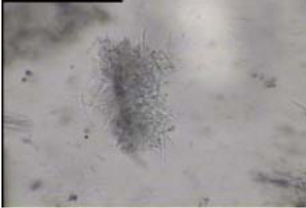
Figure 2. Microphotograph (100x) of microscope field with mallow epidermis and attached hairs

Se probaron los supuestos del análisis de la varianza del experimento factorial con diseño completamente aleatorizado (4x2), mediante la prueba de Cochran para la homogeneidad de varianzas, y la prueba de Shapiro Wilks para la determinación de la normalidad de los datos. Se registraron diferencias significativas entre los índices de similitud en función de la variación de la composición de las mezclas y también en la interacción (Cuadro 2).