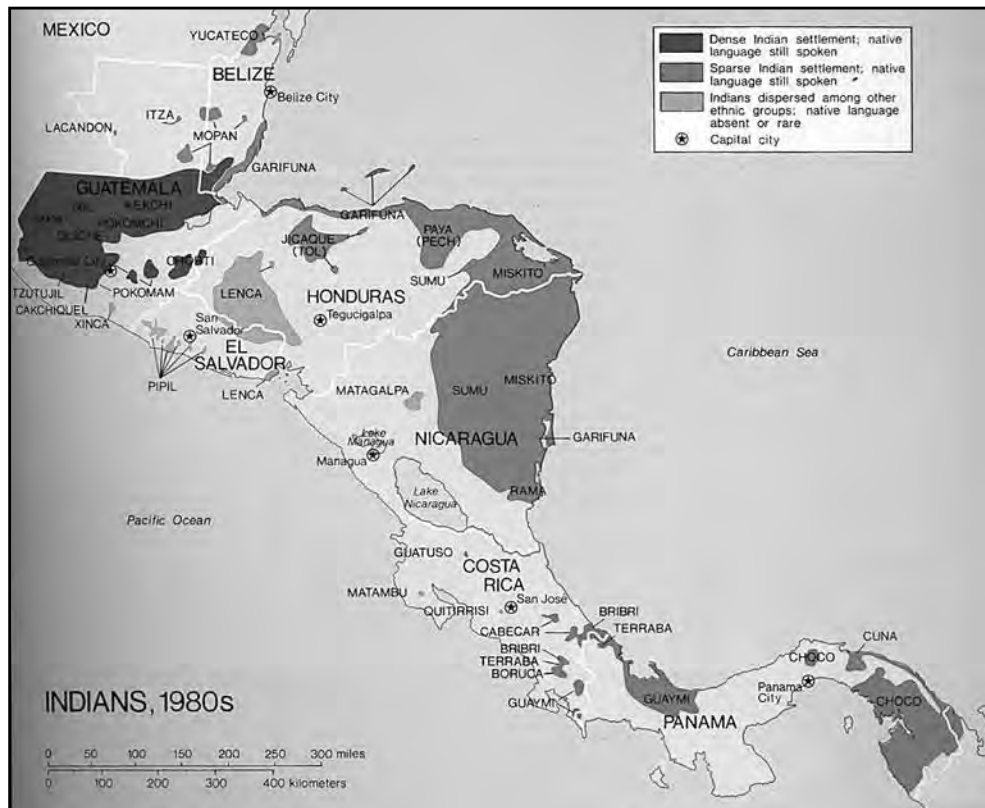
Mapa no. 2. Los indígenas y sus idiomas en la Centroamérica de finales del siglo XX. Tomado de Hall y Pérez Brignoli 2003.