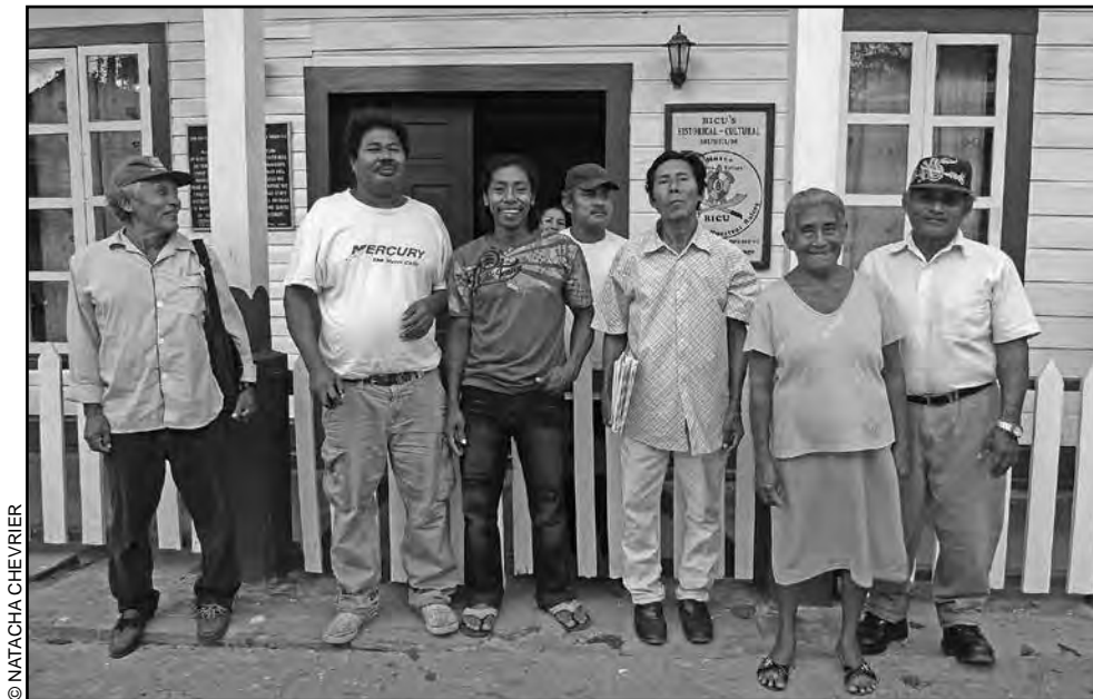
Consejo de Hablantes del Rama delante de las oficinas del BICU-CIDCA, Bluefields, Marzo 2011.

transmisores del rama en las diferentes escuelas de las comunidades (Apr.J. y Apr.S, al igual que dos o tres colegas más).