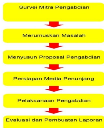
Gambar 1. Tahapan Pelaksanaan Pengabdian Masyarakat

Dalam melaksanakan kegiatan Pengabdian Masyarakat dilakukan beberapa tahapan yang dapat dilihat pada Gambar 1 berikut ini :