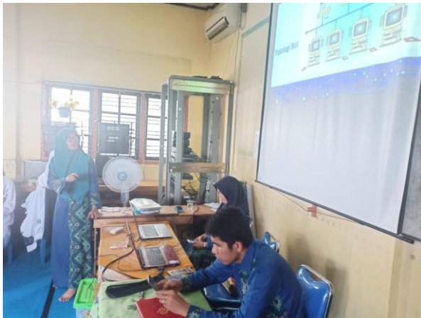
Gambar 5.1. Dokumentasi Pemberian materi dasar jaringan

1. Pemberian materi tentang pengantar dasar jaringan dan desain jaringan Pada kegiatan ini, siswa/i SMKS Ibnu Taimiyah sangat antusias menerima materi dikarenakan belum pernah belajar tentang dasar jaringan dan desain jaringan. Siswa/i merasa tertantang dengan ilmu yang baru mereka dapat dan memiliki keinginan untuk lebih memperdalam mengenai jaringan tersebut. Dibawah ini merupakan dokumentasi saat pemberian materi pengantar dasar jaringan.