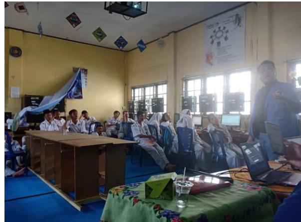
Gambar 5.2. Dokumentasi Pemberian materi Cisco Router

2. Pemberian materi tentang cisco router. Pada kegiatan ini, siswa/i SMKS Ibnu Taimiyah lebih aktif dalam memberikan timbal balik dan menjawab pertanyaan singkat dari pemateri. Hal ini dikarenakan sebelumnya materi terkait dasar jaringan telah mereka dapatkan di kelas dan diawal pertemuan. Dibawah ini merupakan dokumentasi saat pemberian materi Cisco router.