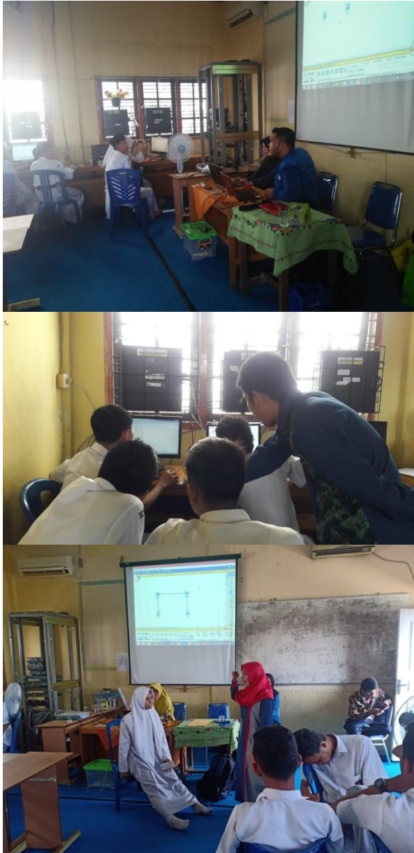
Gambar 5.5. Dokumentasi pelaksanaan Praktikum Simulasi Jaringan Menggunakan Packet Tracer

Setelah pelaksanaan pemberian materi dan praktikum mengenai desain jaringan dan packet tracer siswa siswi dapat disimpulkan bahwa siswa siswi mengalami peningkatan dalam pengetahuan mengenai simulasi jaringan menggunakan packet tracer. Hal ini dapat dilihat dari siswa siswi dapat mengikuti materi dan menjawab pertanyaan kuis serta mereka dapat melaksanakan praktikum secara baik. Dibawah ini merupakan dokumentasi pelaksanaan praktikum pembuatan simulasi jaringan menggunakan packet tracer.