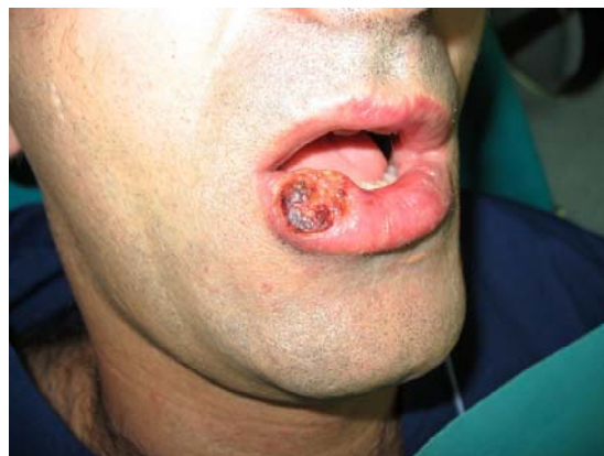
Sl. 1 – Planocelularni karcinom donje usne

U Klinici za maksilofacijalnu hirurgiju Kliničkog centra Crne Gore, u periodu od 2003. do 2008. godine, lečena su ukupno 194 bolesnika sa dijagnozom PCC sluzokože usne duplje. Skoro polovina, tj. 87 (45%) planocelularnih karcinoma kod tih bolesnika bilo je lokalizovano na donjoj i gornjoj usni (slika 1).