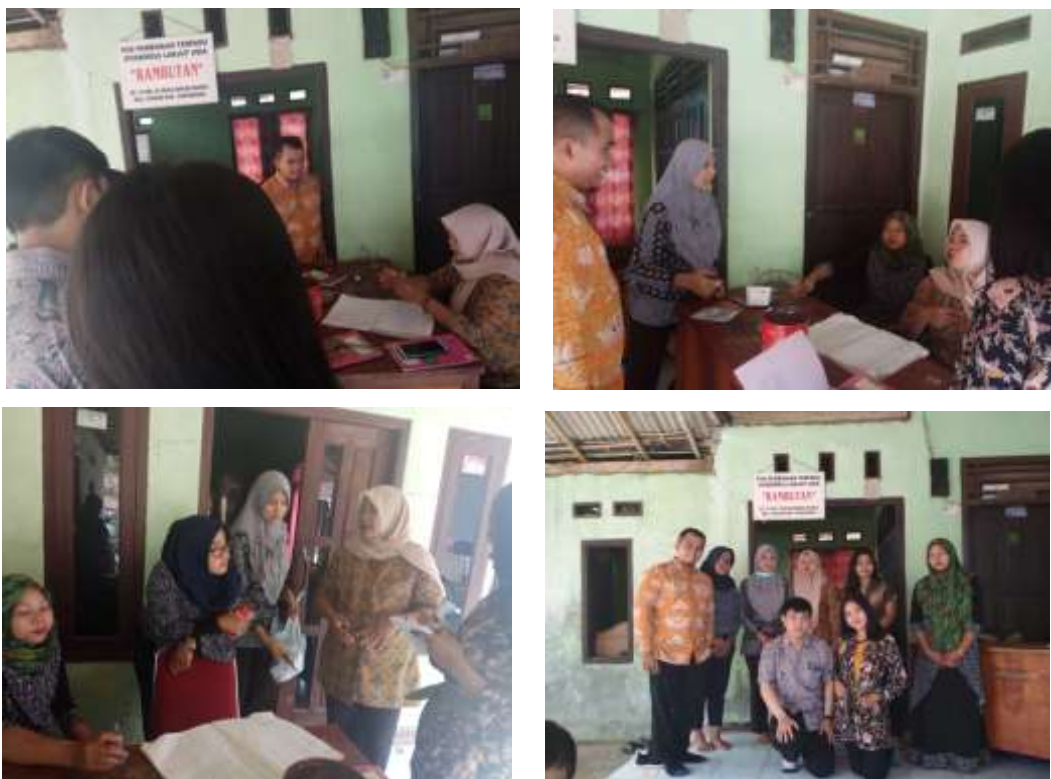
Gambar 5. Proses Edukasi dan Pendampingan Akuntansi Posyandu Rambutan (Kp. Pasir Awi, Rt. 14/05, Ds. Mekarwangi, Kec. Cisauk)

Kegiatan pengabdian kepada masyarakat melalui kegiatan edukasi dan pendampingan akuntansi di Posyandu Rambutan dan Posyandu Nusa Indah ini dilakukan melalui kegiatan pendampingan terkait dengan proses pencatatan pembukuan (akuntansi) Posyandu dari mulai proses pendataan peserta Posyandu hingga proses pelaporan baik terkait informasi keuangan dan informasi non keuangan ke Puskesmas dan Desa Mekarwangi. Tujuan dari kegiatan pendampingan dalam Posyandu ini adalah untuk meningkatkan pemahaman memadai mengenai pembukuan (akuntansi) bagi Para Kader Posyandu dalam proses pencatatan dan pembukuan yang efektif dan efisien. Selanjutnya, kegiatan pendampingan ini juga bertujuan untuk meningkatkan kecepatan dan keakuratan pelaporan pembukuan bagi Para Kader Posyandu baik informasi keuangan maupun non keuangan untuk pihak internal dan pihak eksternal.