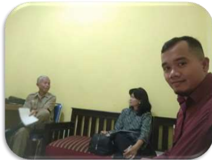
Gambar 3. Proses Peninjauan Kebutuhan Bersama PKM

Berdasarkan hasil peninjauan kebutuhan bersama yang dilakukan pada tanggal 13 Agustus 2019 bertempat di Desa Mekarwangi antara LPPM dan Dosen Akuntansi Universitas Matana dengan Sekretaris Desa Mekarwangi diperoleh keputusan kebutuhan pendampingan akuntansi tahap 1 dilaksanakan di dua Posyandu Desa Mekarwangi yakni Posyandu Rambutan dan Posyandu Nusa Indah. Proses peninjauan kebutuhan bersama sebagaimana dijelaskan pada Gambar 3.