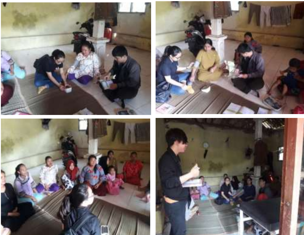
Gambar 6. Proses Edukasi dan Pendampingan Akuntansi Posyandu Nusa Indah (Kp. Lebaksari, Rt. 10/05, Ds. Mekarwangi, Kec. Cisauk)

Posyandu Rambutan berlokasi di Kampung Pasir Awi, Rt. 14, Rw. 005, Desa Mekarwangi, Kecamatan Cisauk, Kabupaten Tangerang. Kegiatan di Posyandu Rambutan berisi Posyandu untuk Ibu Hamil, Batita dan Balita serta dimulai dari pukul 07.30-13.30 WIB dengan pelayanan 4 Kader dan 1 Bidan Desa. Adapun jarak tempuh antara Universitas Matana menuju Posyandu Rambutan sejauh 19,4 km dengan waktu tempuh mencapai 41 menit dikarenakan jalan yang kurang baik. Proses pendampingan pembukuan yang dilakukan di Posyandu Rambutan ini dilakukan melalui proses rekapitulasi semua aspek pencatatan posyandu yang meliputi nama anak kandung, nama ibu, berat badan, umur, peningkatan dan penurunan berat badan, jenis kelamin, dan pemberian imunisasi dan diakhiri dengan proses pendampingan pelaporan ke beberapa format berikut ini: Format 1 (Ibu Hamil), Format 2 (Balita di bawah 1 tahun) dan Format 3 (Balita di atas 1 tahun). Adapun proses edukasi dan pendampingan akuntansi lebih lengkap telah dijelaskan dalam Gambar 5 di atas.