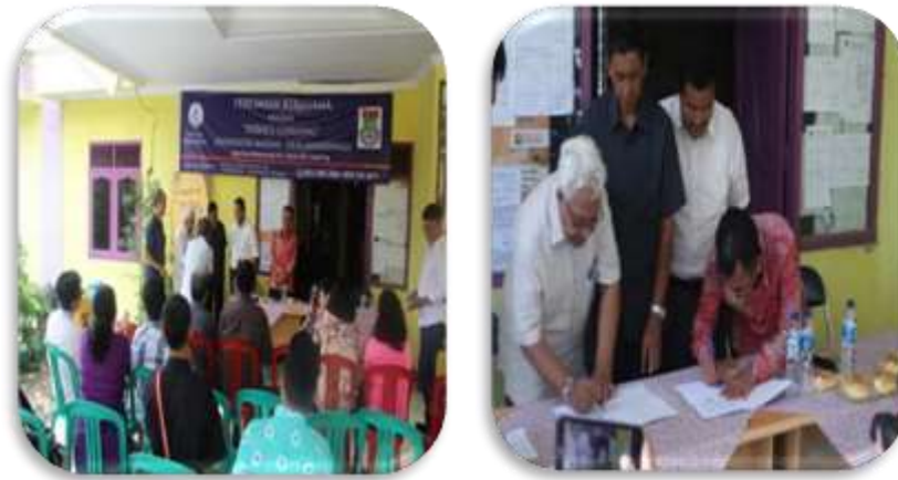
Gambar 1. MoU Universitas Matana-Desa Binaan

Adapun kegiatan rutin yang sudah dilakukan, khususnya di Program Studi Akuntansi, di antaranya adalah pembelajaran akuntansi dasar di SDN Mekarwangi, Cisauk, Kab. Tangerang (Effendi, 2018), pendampingan akuntansi Bendahara dan Pengajar SDN Mekarwangi, Cisauk, Kab. Tangerang (Effendi, 2018) dan kegiatan di tahun 2019 ini yang sedang berjalan adalah pendampingan pembukuan P2WKSS Cilegong Khususnya di Seluruh Posyandu Se-Desa Mekarwangi. Selain kegiatan rutin, terdapat juga kegiatan yang bersifat insidental yang sudah dilakukan seperti bimbingan dan pelatihan akuntansi dan pajak untuk siswa kelas XII Ak di SMK Dharma Widya, Neglasari, Tangerang-Banten (Effendi, 2018).