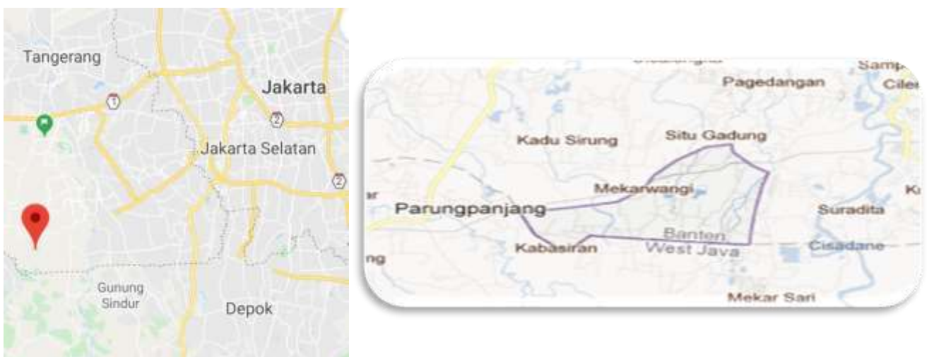
Gambar 2. Peta Desa Mekarwangi, Cisauk-Tangerang

Desa Mekarwangi merupakan salah satu desa yang terpencil berlokasi di Kecamatan Cisauk, Kabupaten Tangerang. Desa yang merupakan desa pemekaran dari Kelurahan Cisauk ini sebagaimana ditunjukkan dalam Gambar 2.