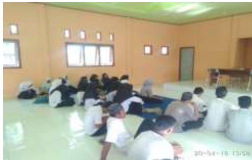
Gambar.1: Kegiatan belajar mengajar

Pengajaran di sekolah Desa Lifofa dilakukan sesuai dengan basis keilmuan. Tahapan dan tahapan awal mengajar pada tanggal 23 Maret - 13 Mei 2018 di semua kelas mulai pukul 08:00-12.00 untuk SD dan SMP dan SMA disesuaikan dengan Mata pelajaran yang diberikan yaitu Matematika, Biologi, PAI, PPKN, Kerajinan Tangan dan Akhlaq.