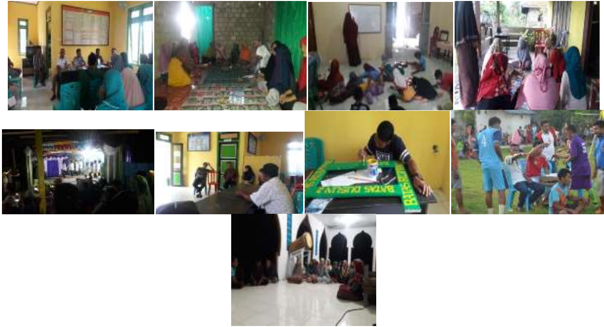
Gambar, 2: Potret kegiatan pengabdian yang sedang berlangsung