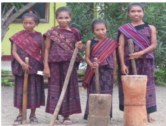
Gambar 1: Alu dan Lesung sebagai Alat Musik Pengiring Tarian Raja Sine

Berdasarkan hasil wawancara yang diperoleh peneliti, dari beberapa narasumber mengenai alat musik bahwa alat musik yang digunakan tidak menggunakan alat musik khusus tetapi tarian ini diiringi dengan suara tumbukan Alu dan lesung.