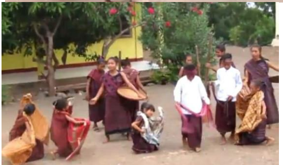
Gambar 2: Anak-anak SDK Lewowuran Flores Timur NTT sedang menarikan Tarian Raja Sine