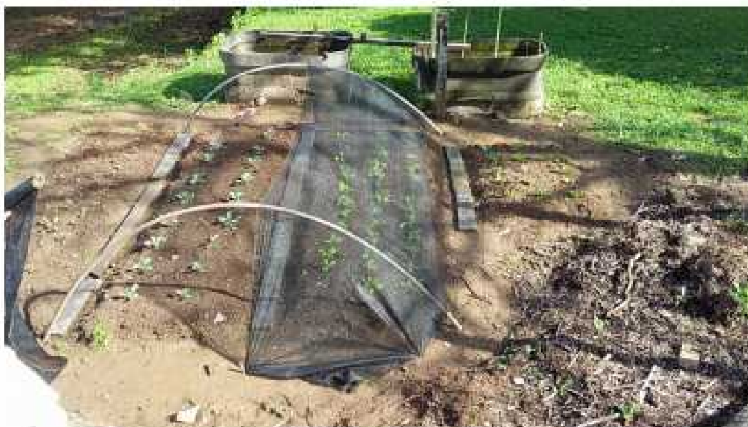
Figura 2: Horta IFC Blumenau / 2016